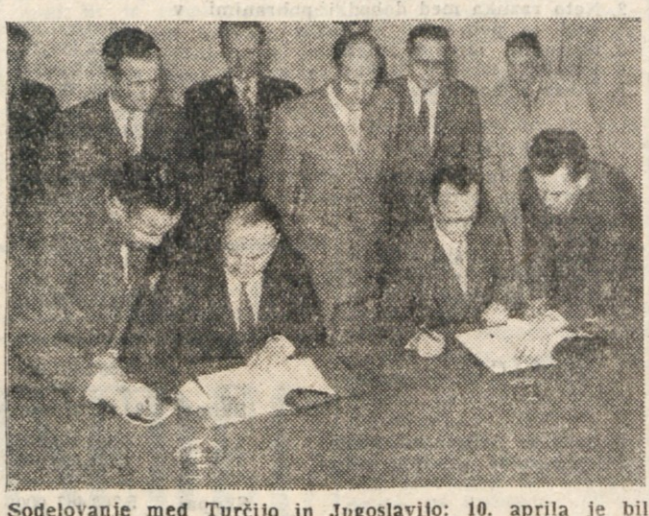
Sodelovanje med Turčijo in Jugoslavijo: 10. aprila je bil v Beogradu podpisan trgovski sporazum med obema državama.