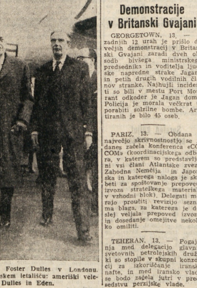
Ameriški državni tajnik John Foster Dulles v Londonu. Od leve na desno na londonskem letališču: ameriški veleposlanik Aldrich, Dulles in Eden.

Eden je moral čitanje poročila večkrat za dalj časa prekiniti zaradi ostrih laburističnih medikacij in protestov. Posebno ostra je bila bevanistična levičarja. Oni del poročila, ki govori o ustanovitvi obrambnega sistema v južnovzhodni Aziji, je bil sprejet z dolgo se ponavljajočimi vzkliki: «Stramota!», medtem ko so na Edenove besede, da bo ustanovitev tega sistema prispevala k častnemu miru v Indokini, laburisti odgovorili s klicem: «Očarjato in z očitki, da je prav s tem sporazumom dosega miru kompromitirana.