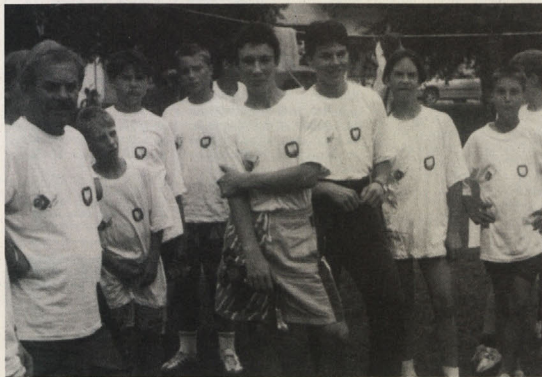
Na sliki: Člani Podjunskega ribiškega kluba na ribiškem taboru v Dragočajni pri Kranju

Tudi letos se je 6 mladih ribičev Podjunskega ribiškega kluba iz Šentprimoža odločilo, da se udeležijo 17. tabora mladih ribičev v Dragočajni, ki je trajal od 11. do 17. julija.