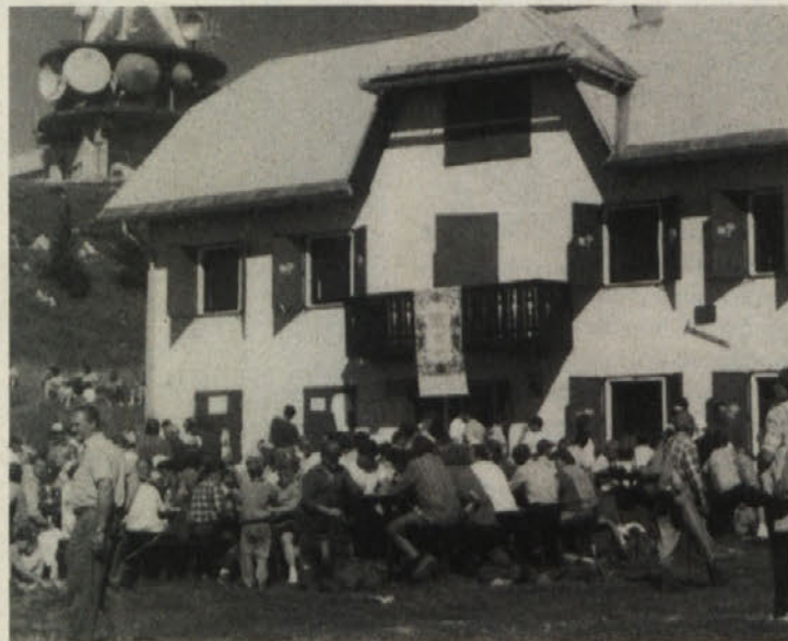
Dom na Uršlji gori

Slovensko planinsko društvo vabi vse ljubitelje gora na gledališko predstavo (igra na prostem)