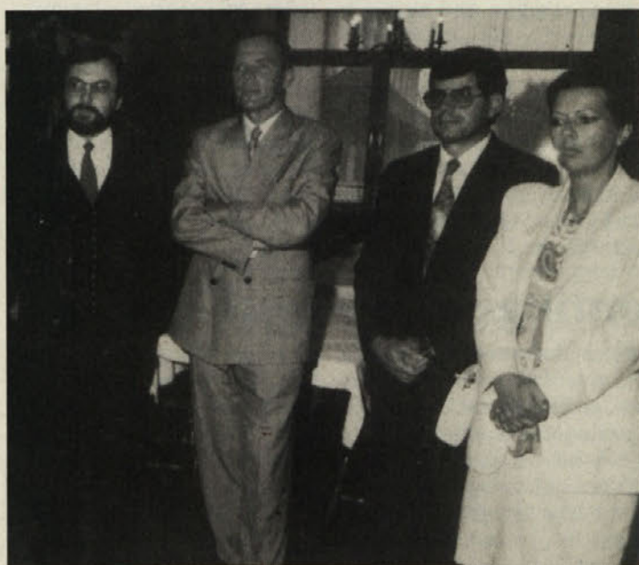
Slovenski gostje so obiskali tudi Pliberka jormak, na sliki z županom