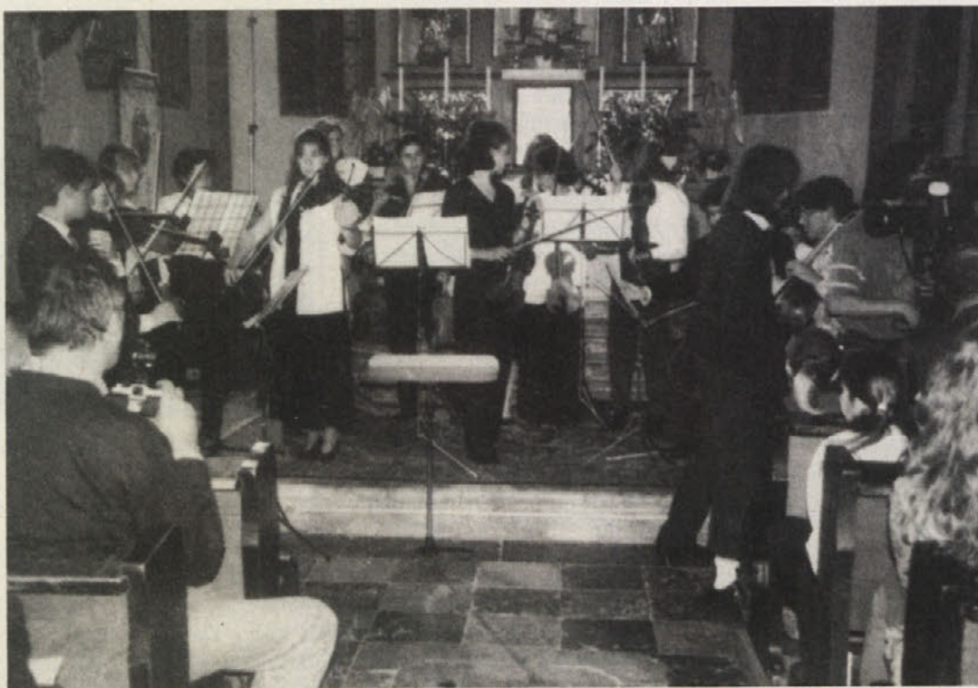
Farna cerkev na Ziljski Bistrici je dala glasbenikom pravi okvir