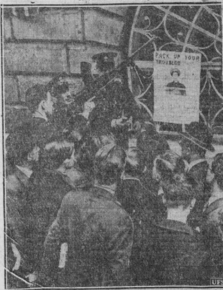
Prizor na neki londonski ulici, kjer častniki kažejo moškim najnovejša orožja, da jih navdušijo za prostovoljno prigrisitev v armadno službo. Zdanji teden je vlada odredila odvezne nabore.

in škatlami. Seveda zaslužijo spriči take tulipomanije tudi izdelovalci in prodajalci lončne robe. Lastniki večji vrtov in nasadov pa delajo kakor povsod tudi na debelo. Obveznice za dobavo vseh mogočih vrst in množin prehajajo iz roke v roke in rodijo nečedno spekulacijo. To so čisto svojevrstne delnice in "loterijske srečke". Po podatkih starih kronistov je bilo že XVII. stoletju za približno deset milijono holandskih goldinarjev takih delnic. Vsa večja mesta severne in južne Nizozemske imajo tudi posebne tulipanske borze. Taka borza je stala v belgijskem mestu Bruggeu v palači bogate rodbine van der Borse. Po imenu lastnika te palače je dobila nemška beseda "Börse" svoje ime.