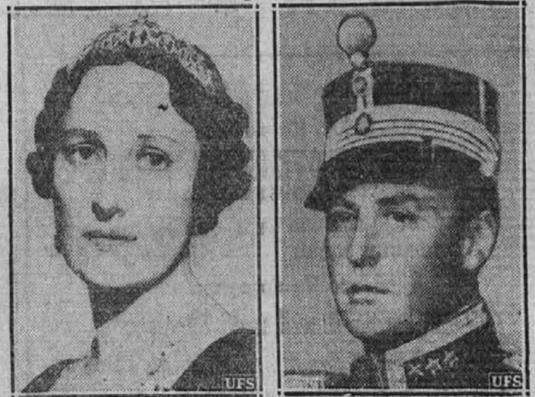
Norveška prestolonasledniška žvojica, Olav in Martha, ki sta točasno na obisku v Zed. državah.