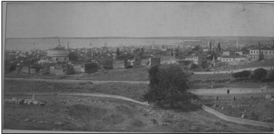
Sl. 2: Pogled na Solun (v: DS, 1).