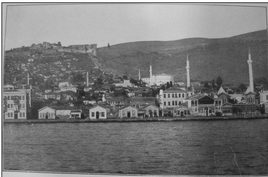
Sl. 1: Solunsko pristanišče (v: DS, 2).