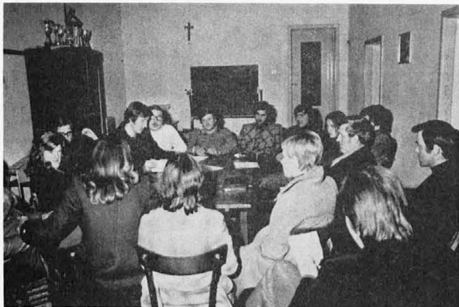
Novi odbor SKPD »F. B. Sedej« v Steverjanu na svoji prvi seji v župnijskem domu