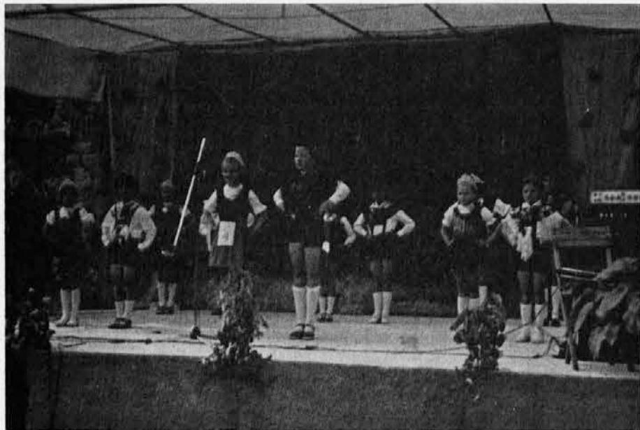
Solski otroci iz Rupe nastopajo na prvomajski proslavi 1975 na prostem pod cerkvijo