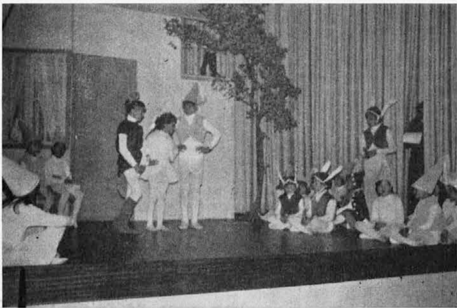
Prizor iz otroške igrice »Na prvi zvezdici se pripelje sv. Miklavž« v župnijski dvorani v Doberdolu 6. decembra 1975