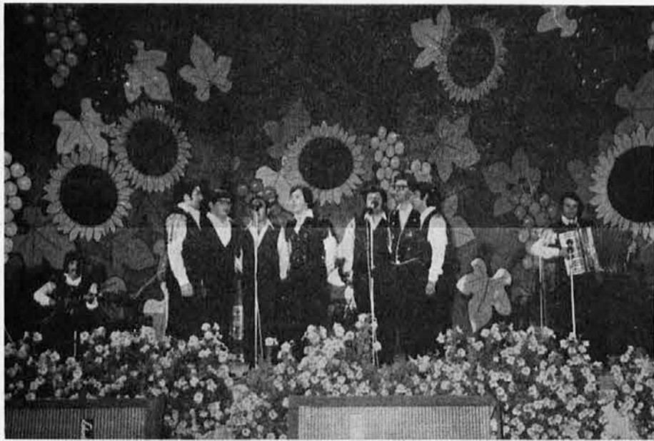
Nastop ansambla »Lojze Hlede« na ptujskem festivalu