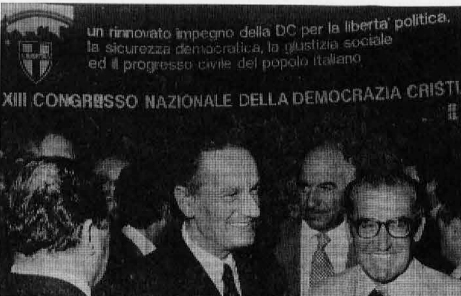
Glavni tajnik Krščanske demokracije Benigno Zaccagnini v pogovoru s časnikarji, ki vneta sledijo poteku kongresa

Jugoslovanski predsednik Tito se je precej utrujen vrnil s svojega potovanja po treh deželah Latinske Amerike. Obiskal je Mehiko, Panamo in Venezuelo. Na povratku se je ustavil na Bermudih in na Portugalskem.