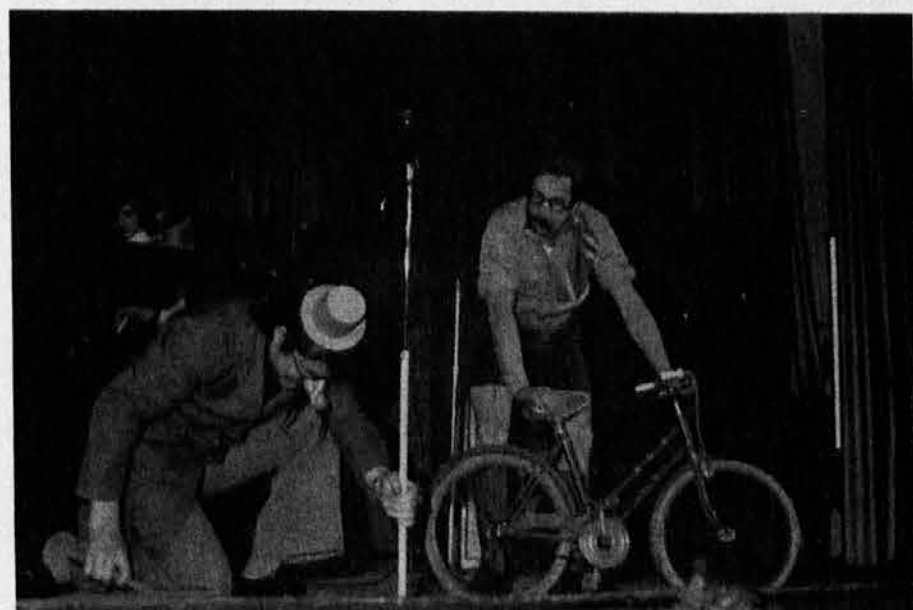
Nastop goriških skavtov na letošnjem pustovanju 29. februarja v Katoliškem domu je prinesel veselo razpoloženje med številno publiko