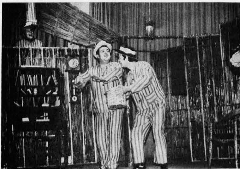
Premiera zabavne igre »Naši trije angeli«, ki jo je podal dramski odsek PD »Standrež« v prosvetnem domu »Anton Gregorčič« v Standrežu