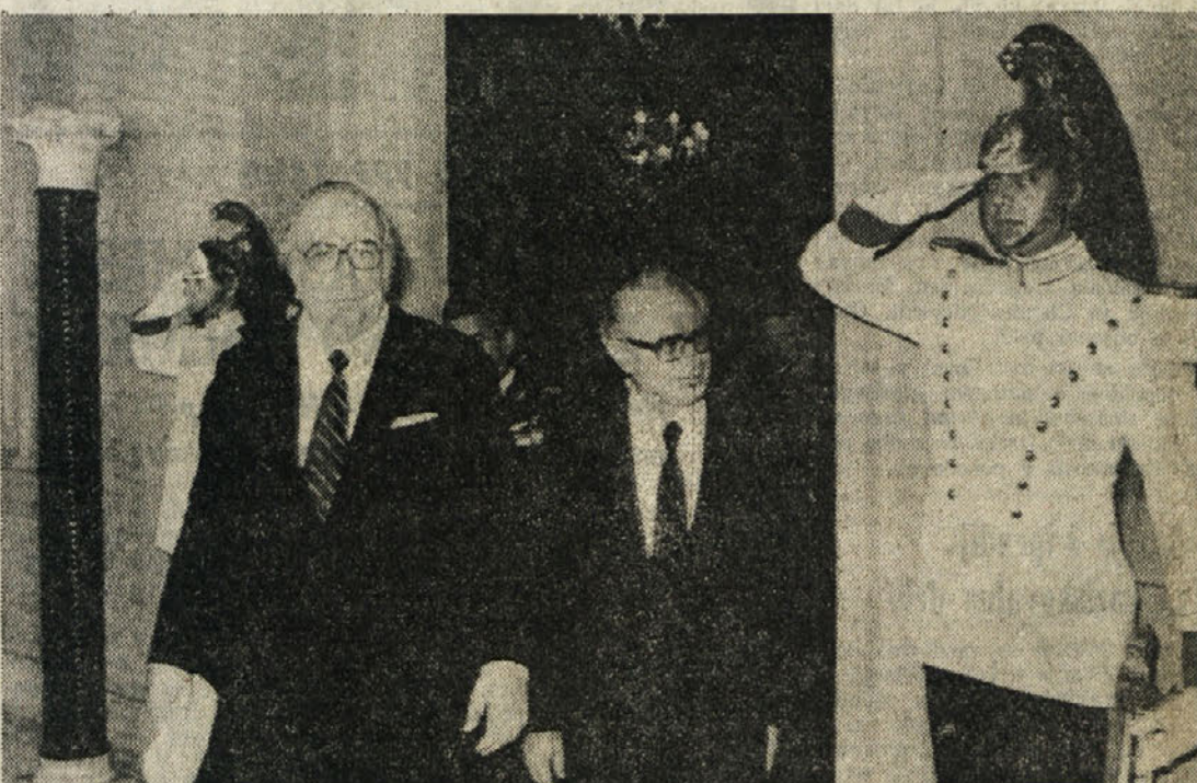
Novi poverjeni predsednik vlade Spadolini zapuša Kvirinal po srečanju s Pertinijem, ki mu je dal mandat

RIM — Giovanni Spadolini je preživel svoj prvi dan poverjenega predsednika pri sondiranju namerov socialistov in demokristijanov in se je srečal s Piccolijem in Craxijem. Uradna posvetovanja se pa začnejo danes zjutraj na sedežu senata v palači Madama, ko bo sredi delegacije KD, KPI in PSI, največjih strank po volilni moči. Popoldne in jutri zjutraj se bo srečal z vsemi ostalimi skupinami parlamenta, s čimer bo zaključil prvi krog stikov, ki mu jih narekuje njegov mandat. Tajnik PRI je prepričan, da ima precejšnje možnosti za uspeh in si je začel takoj prizadevati, da bi njegovo imenovanje ne zapadlo kot polemichen prelom z demokristijani. Ni pa še mogoče reči, kaj ima Spadolini v glavi in kaj bo lahko storil spritno zadržanih strank, namerov predsednika republike in zapletenosti položaja. Po mnenju nekaterih opazovalcev namerava tajnik PRI ciljati na tristrankarsko vlado (KD - PSI - PRI) brez socialdemokratov in tudi brez liberalcev, ki so volilni tekmeči za njegovo stran.