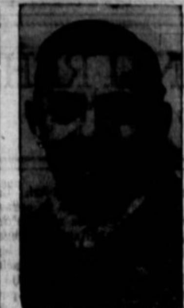
Eddie Cantor, filmski igralec.