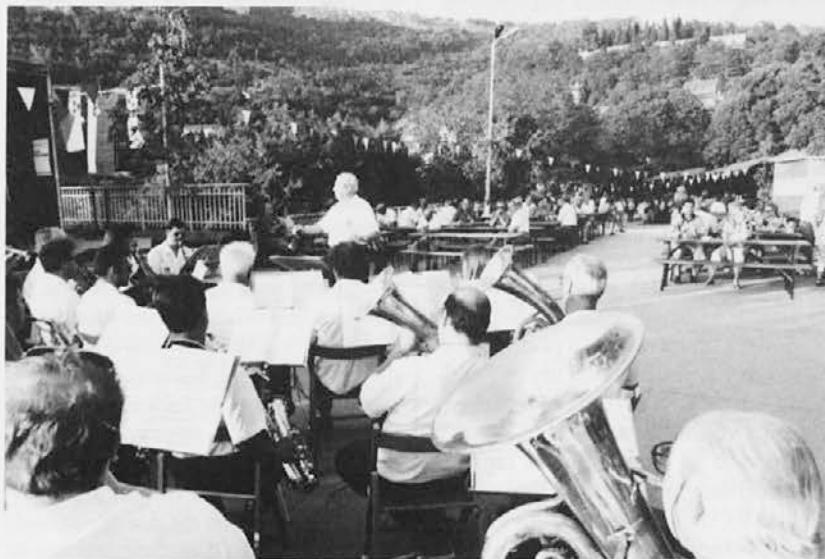
Posnetek s praznika v Zabrežcu