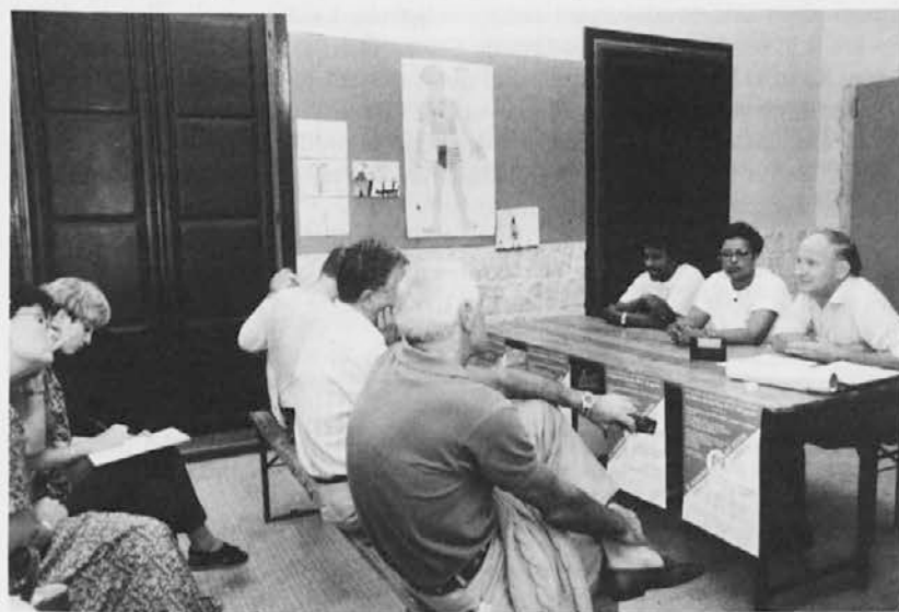
V Prosvetnem domu na Opčinah je bilo vzporedno s praznikom tudi nekaj srečanj, posvečenih problemom priseljencev

Težko je povedati, je še dejala Elena Benvenuto, koliko jugoslovanskih