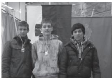
Strelsko društvo Kidričevo

kvalificirati najprej na področnem tekmovanju, kjer je s 368 krogi prav tako osvojil prvo mesto.