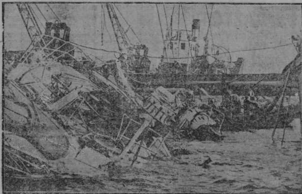
Ponesrečeno nemško šolsko jadrnico »Niobe« so dvignili in potegnili iz no- voroškega trupla z adušenih oficirjev in mornariških gojencev.