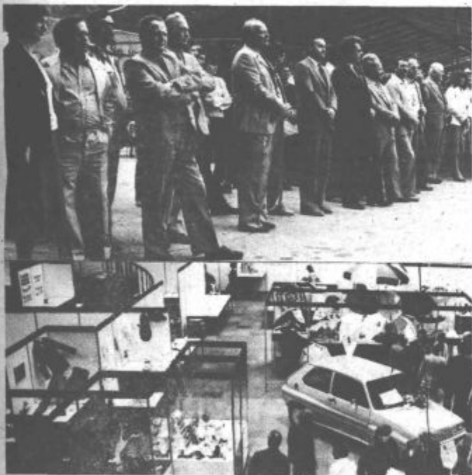
Obrtni sejem je odprt vsak dan od 9. do 19. ure