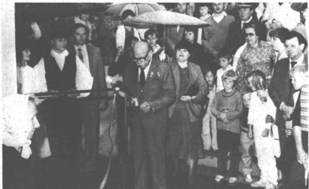
Otvoritve obnovljenih prostorov kulturnega doma se je udeležilo veliko krajanov in ostalih gostov

Naložba jih je veljala kar 32 milijonov dinarjev. Gotovo ni treba posebej omenjati težav in težav, ki so jih krajanega složno premagovali. Sredstva samoprišteva niso zadostovala. Levji delež pri uresnitvi zastavljenih ciljev imata občinska kulturna skupnost ter širša družbenopoliti-