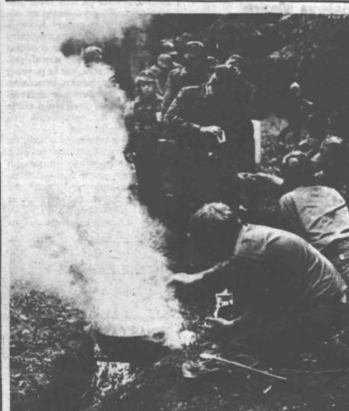
Tudi gozd daje velike možnosti za zadovoljivo prehranjevanje

Tisti, ki imajo toliko veselja do risanja naj se raje javijo društvu prijateljev mladine, ki jih bo z veseljem pritegnilo v naslednjo likovno akcijo.