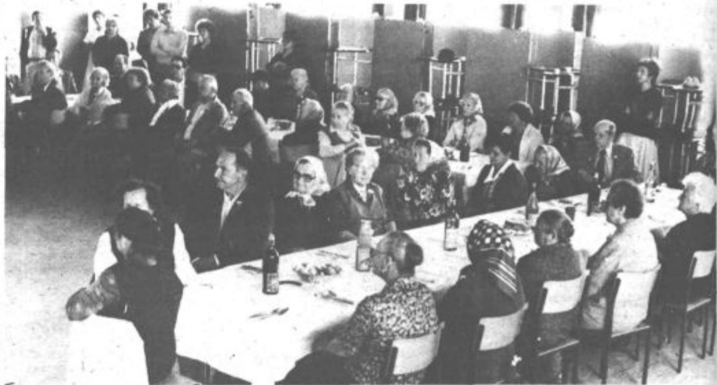
Za marsikaterega udeleženca je bilo srečanje najstarejših krajanov nepozabno doživetje.

Prireditve v počastitev krajevnega praznika so klenili v ponedeljek z nastopom pevskih zborov osnovnih šol bratov Mravljakov in Veljka Vlahovića. S tem je bilo sicer konec bogatega praznovanja, ne pa tudi dela v krajevni skupnosti. Saj je uspel referendum naložil nove naloge in veliko dela. mkp