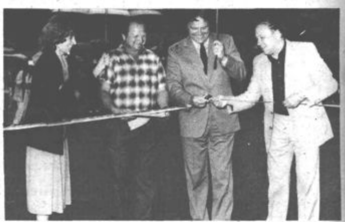
Ob praznovanju tudi pridobitev. Cesta, ki povezuje krajevno skupnost Šalek-Gorica s KS Bevcé.