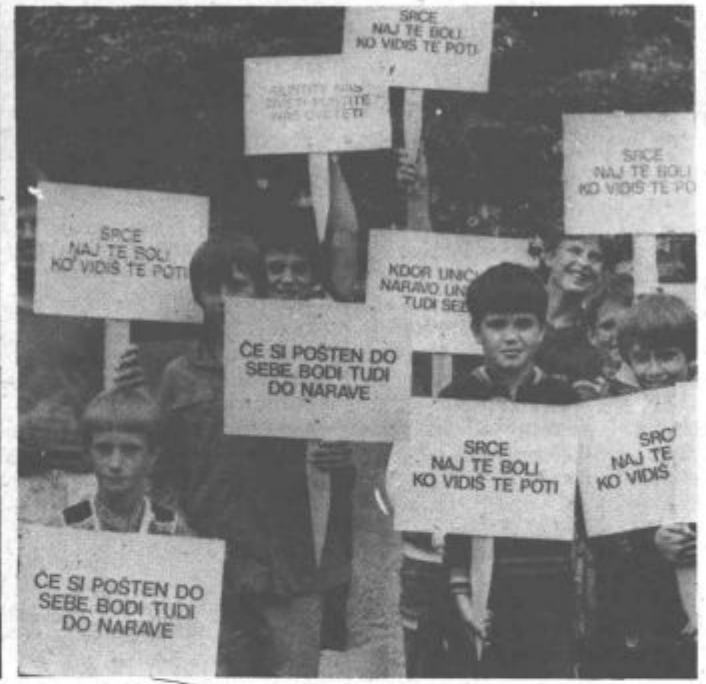
Člani zelenih straž so postavili opozorilne table