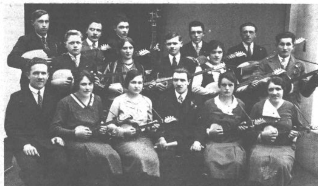
Današnji fotografiji nam je v uredništvo prinesel Martin Menih iz Tavčarjeve 20 v Titovo Velenje.

Na eni je praznik kmečkih fantov in deklet v Družmirju, pred 2. svetovno vojno, na drugi pa je tamburaški zbor v Družmirju leta 1937.