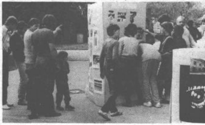
Člani foto kluba Zrno so pripravili priložnostno razstavo »Naj mar jočem nad tabo mesto moje«

Na to so opozorili tudi člani Foto kluba Zrno, ki so pripravili sedaj že tradicionalno razstavo Naj mar jočem nad tabo mesto moje, ki so jo tudi v petek postavili ob koncu Cankarjeve ceste ter s fotografijami pokazali na naš omalovažujoč odnos do težko pridobljenih družbenih dobrin. Več odgovornosti, ne le na delovnem mestu, ampak tudi v drugače, nam prav nič ne bi škodilo.