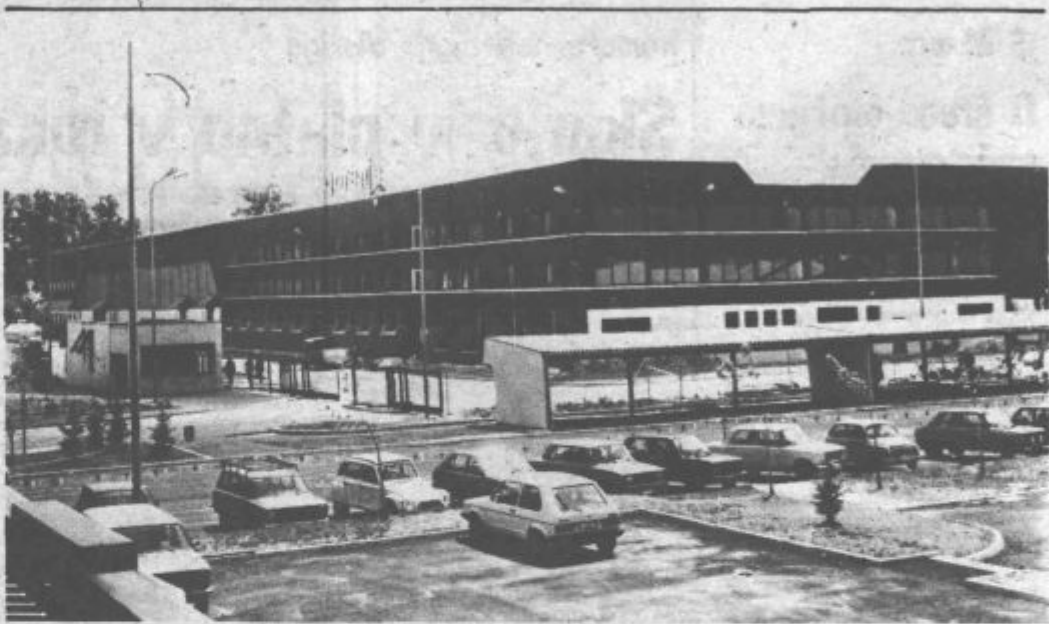
Pogled na novo tovarno Gorenje Bira v Bihaću

Proizvodnja bo tehnološko zaokrožena, pomembno pa je tudi, da ne bo onesnaževala okolje. Poudariti pa velja še, da bo mogoče na štirih linijah proizvajati istočasno štiri tipe aparatov. Končna kontrola pa bo v celoti vodena s pomočjo računalnika. Delavci in strokovnjaki nove to-