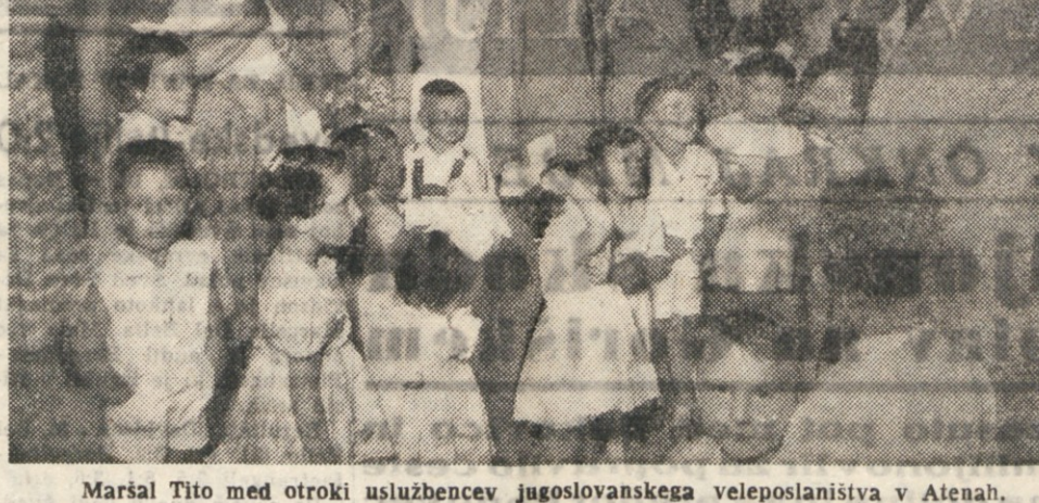
Maršal Tito med otroki uslužbencev jugoslovanskega veleposlaništva v Atenah.