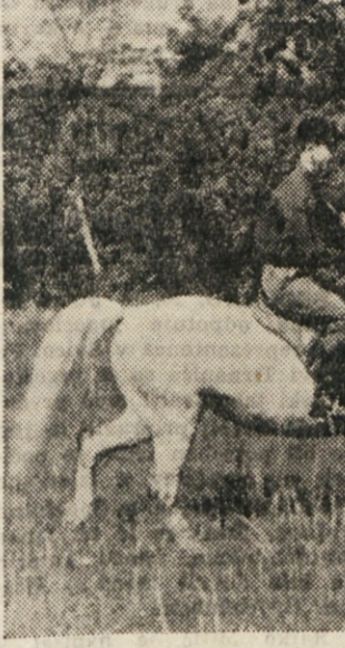
Dva lipicanev na sprehodu.

lipicanev. V letu 1938, ko so jo v Prestranku formalno operativno vojaško bazo, so zgradili še nekaj poslopj in utrbh.