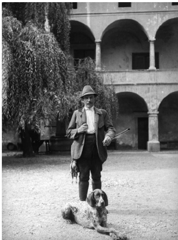
Fotografija 7: Lovec na grajskem dvorišču Ravno polje.

to ne bi bilo mogoče, pa naj se ohrani vsaj v tistih pokrajinah, ki bi se izrekle za ta sistem prostovoljno. Novi državni zakon bi moral biti potem le splošni okvirni zakon. Priporočili so, da naj vsi lovski zakupniki skrbijo za krmljenje divjadi v hudi zimi, preprečujejo odkup divjačine od nelovcev, in da naj strogo zasledujejo lovske tatove. V ta namen je določila centrala 5.000 din za nagrado orožnikom, ki bi se izkazali v tem pogledu kot posebno vestni in vztrajni. Sprejet je bil predlog, da morajo biti vsi zakupniki in pazniki člani SLD in da ne sme noben zakupnik povabiti gosta, če ni član SLD.