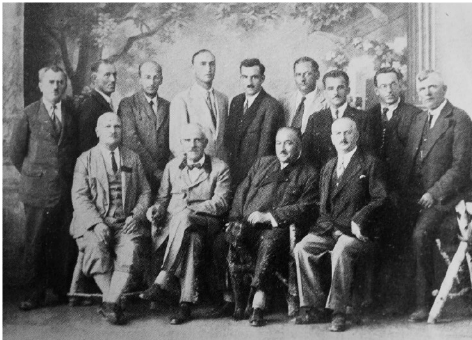
Fotografija 8: Odborniki ptujske podružnice SLD 1932