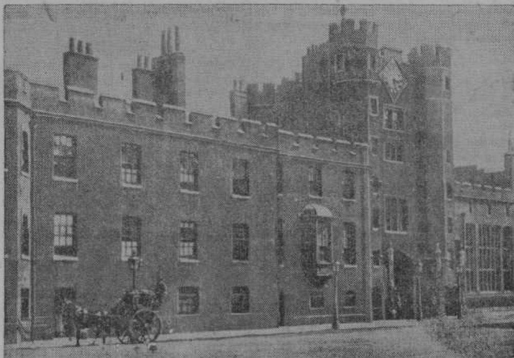
Palača sv. Jamesa v Londonu, kjer je zboroval svet Društva narodov glede nemško-francoskega spora.