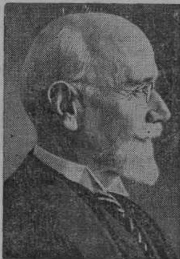
Grški državnik Venizelos je umrl v Parizu.