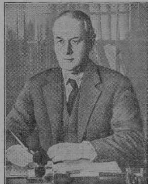
Novi angleški obrambni minister T. Inskip.