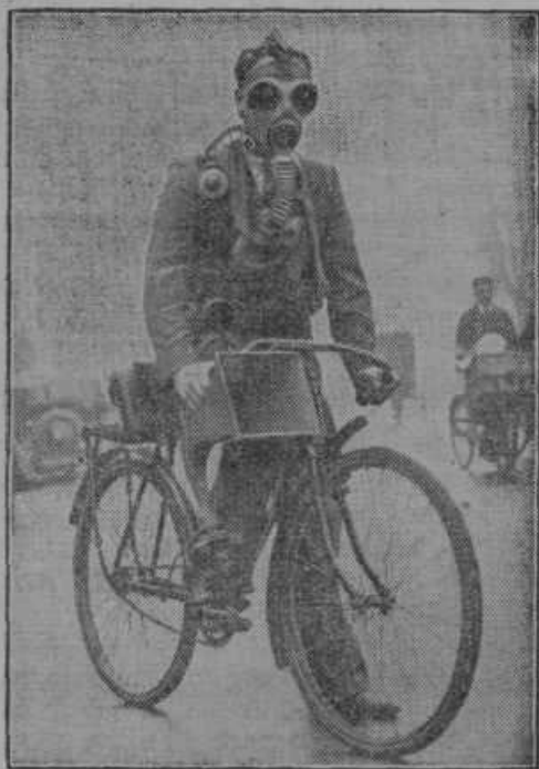
V Hendonu pri Londonu so preiskovali kot svarilo kolesarja z masko proti strupenim plinom in z zvočnikom. Kolesar bo svaril občinstvo za slučaj plinskega napada.