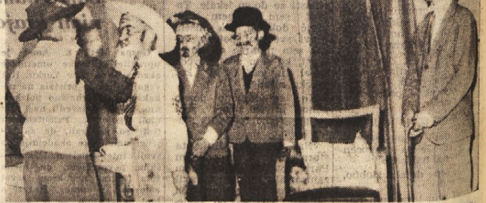
Prizor iz šaljive igrice «Čudezna brivnica» v izvedbi učencev nabrezninske osnovne šole.

Kot vsako leto tako so nam osnovne šole pripravili prav lepe prireditve, ki so bile za učence in učitelje zelo zanimive in koristne.