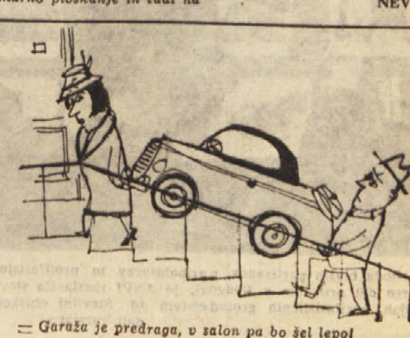
Garaja je predraga, v salon pa bo šel lepota. — NEVA

Beograščanke so pa bile pretekle dni deležne posebne sreče — ogledale so si lahko od blizu kar 48 manekenk šestih narodnosti, ki so jim na Drugem mednarodnem festivalu ženske mode prikazale bleščake mode najslavnejših modnih hiš. To je bil dogodek ne samo za ženske, temveč tudi za moški svet, hkrati pa tudi za novinarje, ki so se v tistih dneh zbrali v Beogradu z vseh vetrov sveta.