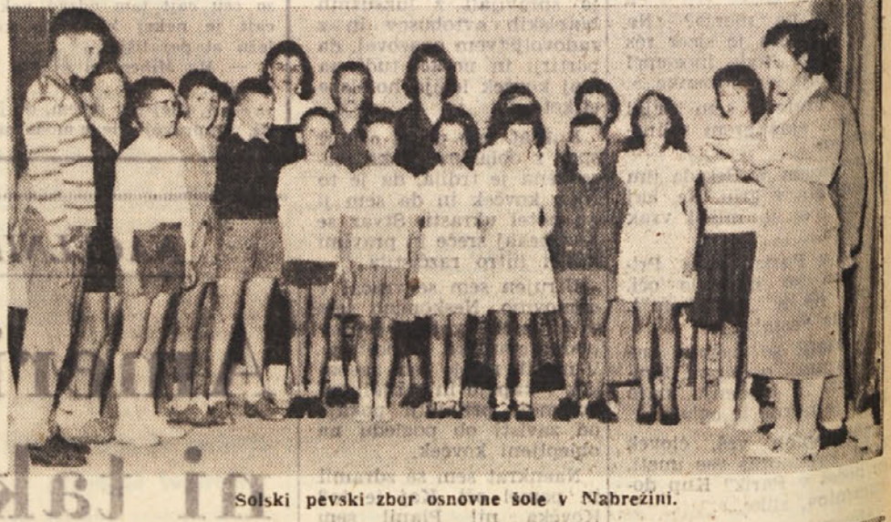
Solski pevski zbor osnovne šole v Nabrezini