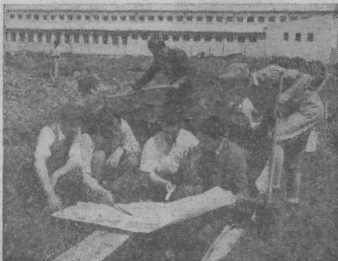
Tehniki in delavci se posvetujejo o planu

S tem se ne zmanjšujeta pomen in učinek depozita kot pozitivnega instrumenta v izvajanju določene investicijske politike, temveč se ustvarjajo uprivičene olajšave za izvršitev investicij, za katera so sredstva že zagotovljena.