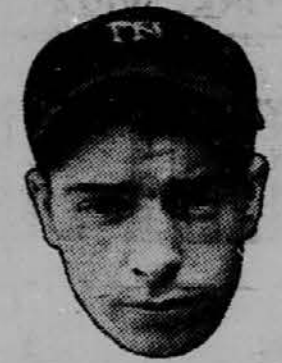
Pripoveduje, čemu morajo atleti vključiti mleko v treniranje

Še pred par meseci Yankee novinec, danes pa zvezdnik na svojem mestu, daje Joe Di Maggio mleku dosti kredita za svoj izreden podvig. "Da," pravi Joe, "prvo leto je najhujše izmed vseh. Ko stopiš na "plate", ali ko kdo odbije žogo skrbil le, da ne prideš v zadrego. Tisti delec sekunde zahteva hladne živce in gotov odziv. In to je vzrok, čemu je mleko potrebno. Kajti mleko spravi v sklad vaše živce, mišice in možgane." In znanost potrjuje to kar pravi Joe Di Maggio. Mleko je eno najfinejših hraniv za živce. Mleko vam bo pomagalo misliti hitreje in delati hitreje. In seveda, mleko je eno najbolj cenjenih živil, ki jih morete kupiti. Bureau of Milk Publicity, Albany.