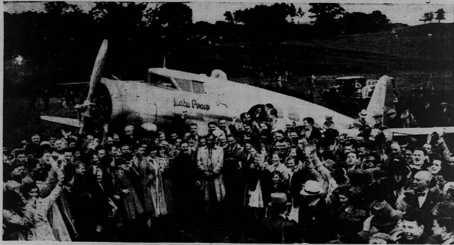
Amerikanca Harry Richman in Dick Merrill sta bila prisiljena pristati v Llandilo v Južnem Walesu, zatem ko sta preletela Atlantik v osemnajstih urah. Doslej ga ni preletel še noben letalec v tako kratkem času.