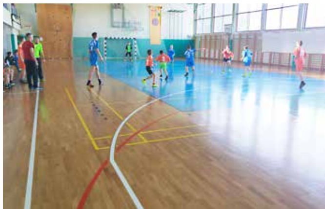
Tekma med OŠ Grad in OŠ Cankova