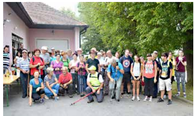
Pohodniki Graščakove poti pred Info pisarno v Radovcih