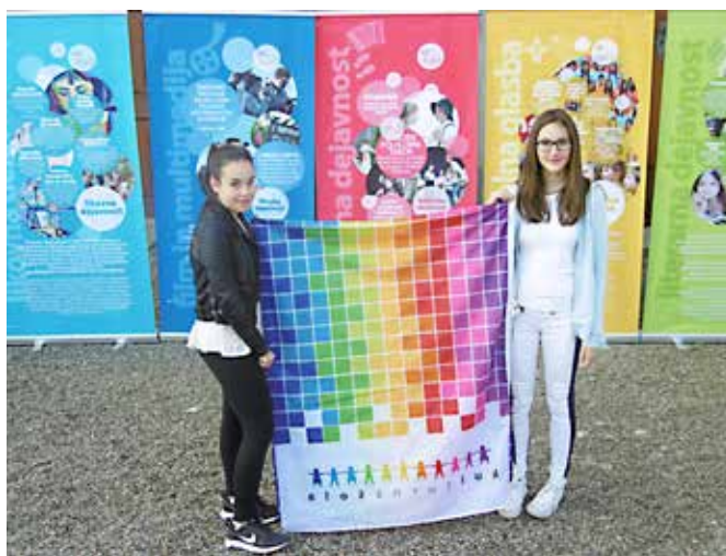
Tina in Maja z zastavo »Kulturna šola«, ki bo krasila OŠ Grad naslednjih pet let.