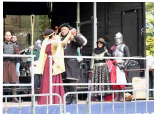
In smo zaplesali