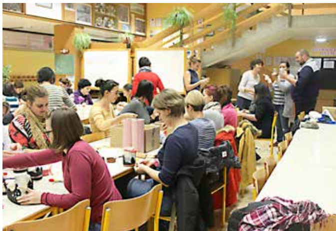
Na delavnici so nastali lepi izdelki

Klaudija Gomboc , pomočnica ravnateljca za enoto vrtca