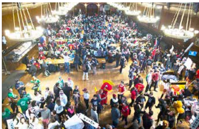
Pestro dogajanje na Univerzi Harvard ob dnevu odprtih vrat za študente

tično znanje. Tamkajšnji izobraževalni sistem namreč temelji pretežno na praktičnem usposabljanju in mladim omogoča veliko praktičnega znanja, katerega pa v našem izobraževalnem sistemu žal primanjkuje. Mladostniki so mnenja, da si tam lahko vsakdo, ki je pripravljen tvegati, zagotovi veliko bogastvo, zagotovi nova delovna mesta, omogoči hiter razvoj novih izdelkov, ki na hitro ljudem omogočijo izboljšanje kakovosti življenja in povečanje produktivnosti v gospodarstvu nasploh.