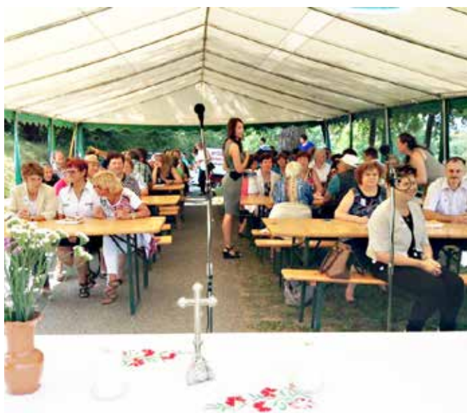
Veseli vaščani pri zvoniku na Cmorovem bregu