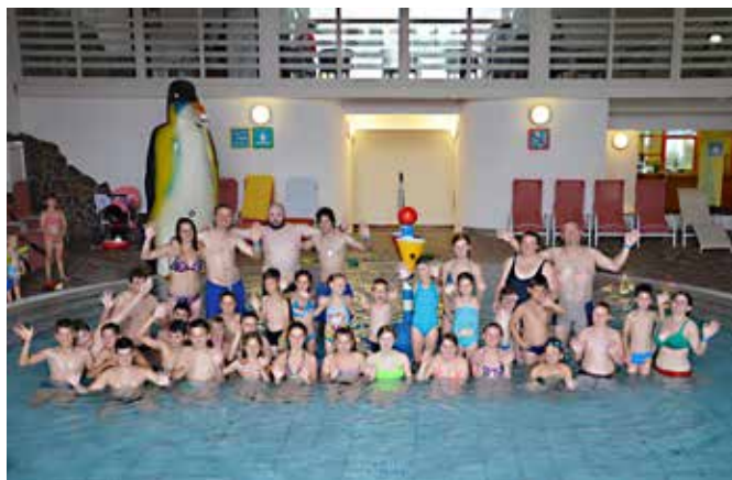
Gasilski tabor GZ Grad

Med 15. in 18. julijem je v vaseh postalo tiho in mirno. Manjkal je živžav. Gasilska zveza Grad je namreč svoj podmladek odpeljala na letovanje v planine. Odpravili smo se na gasilski tabor na Roglo, kjer smo preživeli čudovite štiri dni. V petek dopoldan smo pomahali staršem v slovo in krenili na potovanje do cilja na nadmorski višini 1517 m. Po hitri namestitvi smo smuknili v kopalke in obiskali hotelski bazen ter preverili svoje plavalne in dihalne sposobnosti. Naslednji dan se je začel že zelo zgodaj. Odpravili smo se namreč v raj vsakega malega gusarja – v Terme Zreče. Po končanem potapljanju vseh človeških bark v bazenu, smo se odpravili nazaj v višine, kjer smo si, kot pravi gasilci, razgibali svoje okončine v telovadnici, v kateri gostuje podpisan dres Petre Majdič. V nedeljo zjutraj smo reševali mačko z drevesa. Preizkusili smo se namreč v športnem plezanju po plezalni steni. Ker smo se zjutraj vzpenjali, smo se popoldan spuščali v dolino. Obiskali so sankališče Zlodejevo. Adrenalinsko uživanje. Še krave na sosednjem pašniku so nam zavidale. Naslednje jutro smo se žal že morali posloviti od bungalovov, osebja in sosedovih krav ter kreniti na pot proti domu. Prva postaja je bila kar hitro. Ustavili smo se že ob samem vznožju Rogle. Obiskali smo PGD Zreče, kjer smo spoznali delovanje njihovega društva in preverili opre-