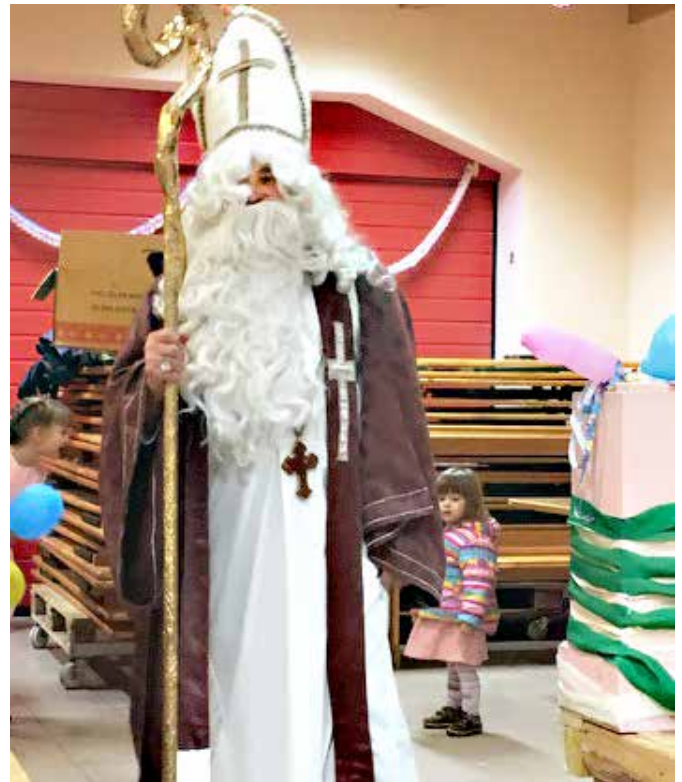
Miklavž je obdaril otroke v Kruplivniku