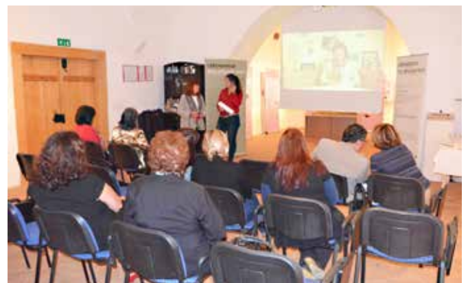
Odprte razstave Življenjske poti

V Javnem zavodu Krajinski park Goričko smo z Dnevi evropske kulturne dediščine pričeli 29. septembra z odprtjem razstave Življenjske poti – slovenske zdomske delavke na avstrijskem Štajerskem.