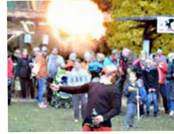
Kaj vse znamo!