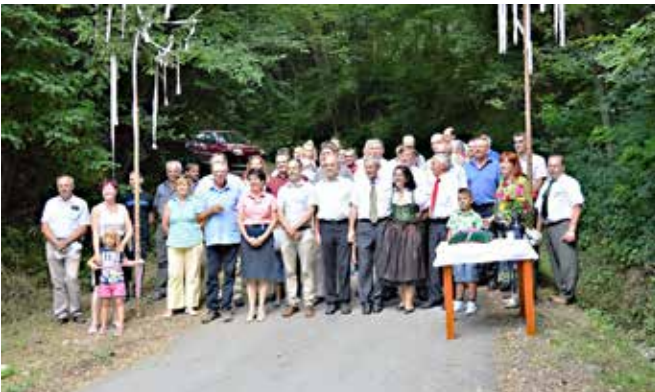
Skupno veselje

čanov ob novih pridobitvah se je nadaljevalo s pogostitvijo gostov, plesom na glasbo Ansambla Horizont. Torej za razvoj kraja smo odgovorni vsi, obnašati se moramo odgovorno, biti ponosni na to, kar imamo in kar smo. Pomembno je usklajevati različne interese in imeti urejene odnose med seboj, kar je zagotovilo za razvoj kraja. Veliko truda bo v prihodnje potrebno še vložiti za uspešen razvoj. Hvala vsem za vse, kar naredite dobrega za našo občino.