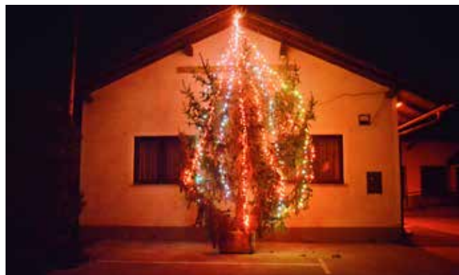
Novoletna jelka na Dolnjih Slavečih

Tudi letošnji adventni čas smo popestrili s postavitvijo božično novoletne jelke, ki bo krasila vas in okolico gasilskega doma na Dolnjih Slavečih. Na prvo adventno