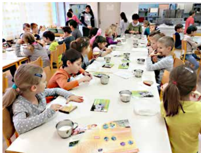
Tradicionalni zajtrk v jedilnici OŠ Grad