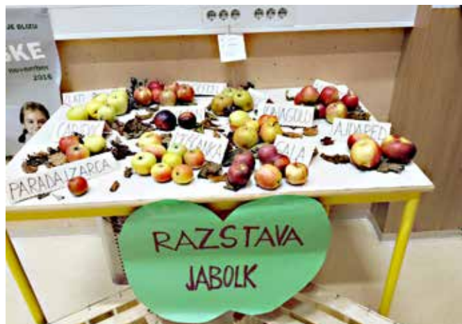
Jabolka se zelo zdrava, še posebej zjutraj