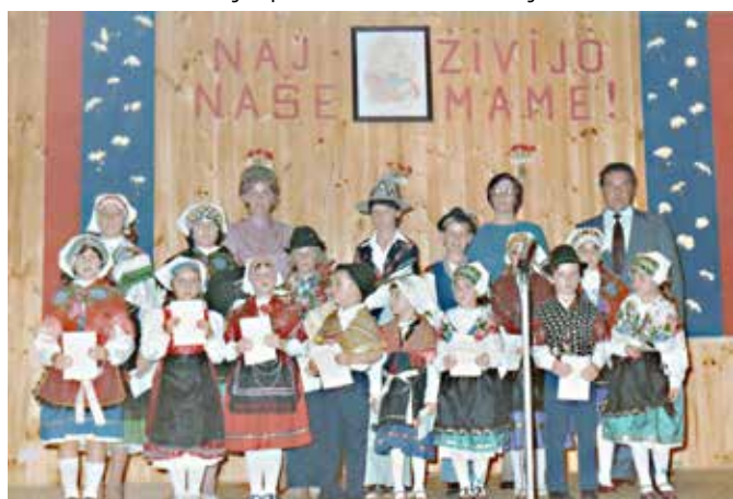
Otroci slovenskih izseljencev nastopajo ob materinskem dnevu na slovenski proslavi, v Montrealu leta 1985

V Južni Ameriki se je največ Slovencev naselilo v Argentini. Prvi slovenski izseljenci so bili katoliški misijonarji, kasneje predvsem v začetku 20. stoletja so sledili še drugi. V nasprotju z izseljevanjem v ZDA so v Argentino emigrirali v prvi vrsti politični izseljenci, ki so v Argentini zasloveli po svoji »trdi« organiziranosti in že takoj na začetku so organizirali svoja društva, začeli izdajati svoje časopise, imeli svoje cerkve in ustanavljali šole. Ker so v veliki večini to bili politični izseljenci in njihovi potomci, je njihov cilj še danes ohraniti slovenski jezik, kulturo in določene vrednote. Tudi Prekmurce najdemo v Argentini, imajo celo svoje društvo, imenovano Prekmurski arhiv v Argentini, katere vodilo je prikazati življenje Slovencev – Prekmurcev v Argentini, in tudi zgodovino, življenje in kulturo iz Slovenije, posebno iz Prekmurja.