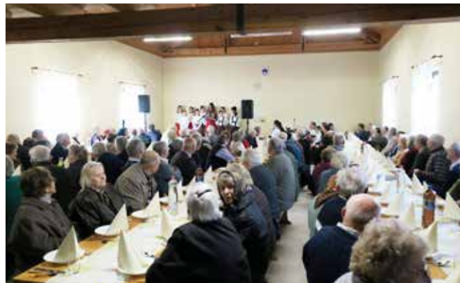
Starejši občani na tradicionalnem srečanju