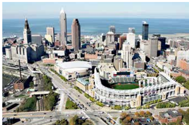
Cleveland – mesto v ZDA, zvezna država Ohio, kjer se danes živi največ Slovencev