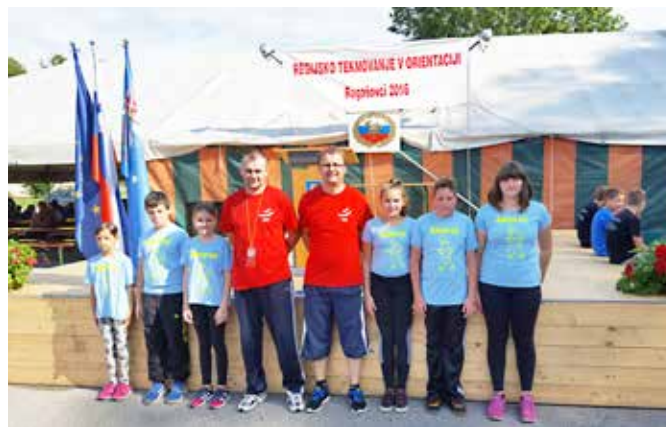
Pionirji in mladinci PGD Dolnji Slaveči

poplačan. Gasilska zveza Grad je letos prvič organizirala skupno letovanje za vso gasilsko mladino GZ Grad, o katerem boste več izvedeli v posameznem prispevku.