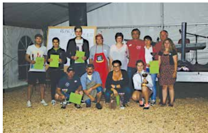
Občinske vaške igre v Motovilcih