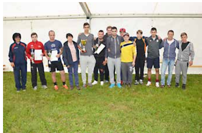
Podelitev priznanj