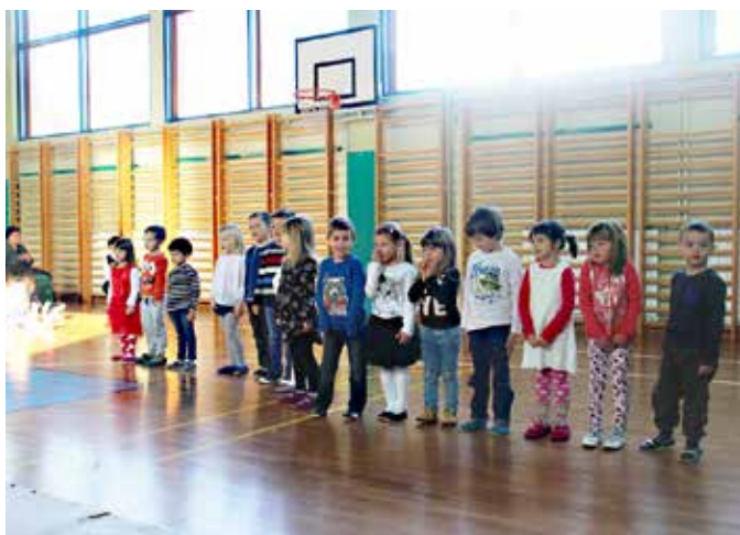
Otroci so nastopili za babice in dedke