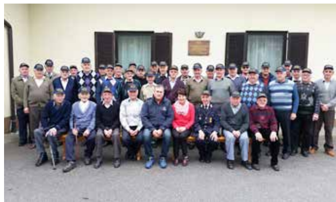
Gasilski veterani GZ Grad