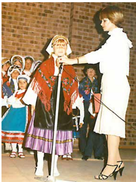
Učenci v slovenski šoli z učiteljico. Hčerka recitira pesem ob Dnevu žena, okrog leta 1982