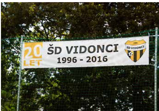
ŠD Vidonci je ob 20-letnici spet gostil več ekip na turnirju

Člani ŠD Vidonci smo tudi letos 21. avgusta organizirali mednarodni turnir v nogometu. Kot vsako leto se je tudi letos turnirja udeležila ekipa Čehov iz Rusije. Na turnirju so sodelovale še naslednje ekipe: slovenska vojska, Dengrad, Soboški nagibači, Otovci, in nogometaši iz Ljubljane