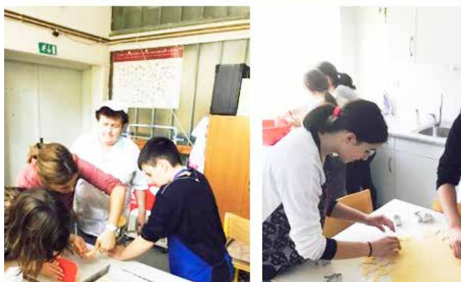
Učenci so že pravi kuharji