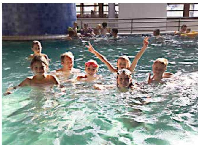
Plavalne aktivnosti v Termah 3000