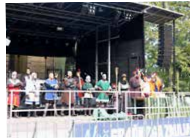
Kakšna je bila pobrana tlaka