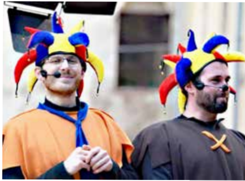
Macho in Mejke - dvorna norčka