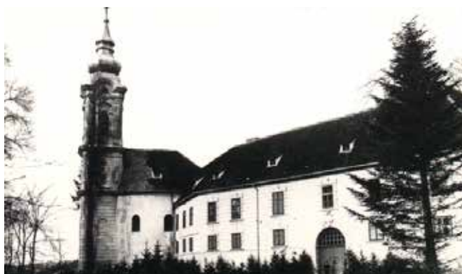
Grad Gornja Lendava v prvi polovici 20. stoletja