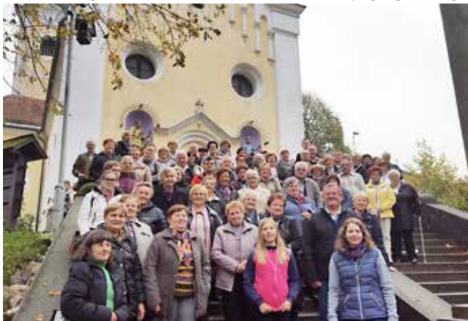
Skupinska slika gračkih romarjev