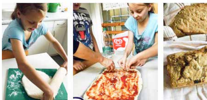
Uh, kako je dobra ta naša pica