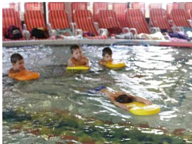
Otroci so se učili osnov za plavanje