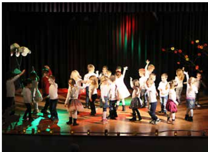
Pred prihodom Miklavža so nastopili otroci iz vrtca

Klaudija Gomboc , pomočnica ravnateljca za enoto vrtca