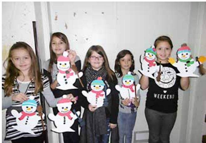
Ali niso lepi ti naši snežaki

Naša osnovna šola je bila izbrana na razpisu za petletni projekt Popestrimo šolo, ki ga je objavilo Ministrstvo za izobraževanje, znanost in šport. Projekt smo začeli izvajati s 1. 11. 2016. V okviru projekta vsako jutro pred poukom prebiramo knjige in pripovedujemo zgodbe. Za božični bazar smo nabirali storže in druge plodove ter sušili pomaranče, pomagali smo tudi pri peki keksov. Izdelovali smo izdelke iz naravnih materialov in papirja. Udeležili