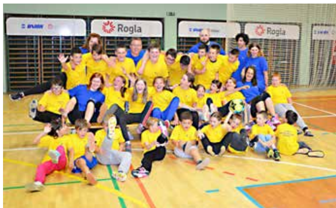
Mladina GZ Grad

mo ter vozila. Bili smo pravi mali detektivi v odkrivanju vseh skrivnosti le-teh. Pred toplim maminim objem in poljubom smo se še okrepčali v znani restavraciji s hitro prehrano in obljubili, da se naslednje leto zopet srečamo. Za spomin na 1. gasilski tabor Gasilske zveze Grad pa smo mladi gasilci in naši mentorji prejeli majice, ki jih je podarilo podjetje Arcont IP d.o.o. iz Gornje Radgone. Bile so v barvah minionov, rumene za otroke in modre za mentorje. Zakaj? To pa naj ostane skrivnost! In napoved za naslednje leto. Lepše vreme. Obljublajo.