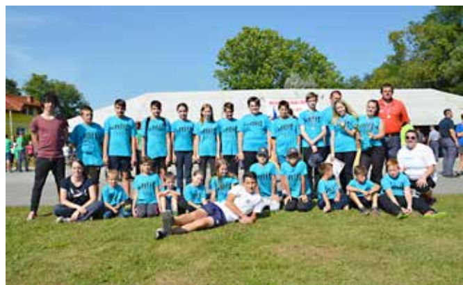
Pionirji, mladinci in pripravniki PGD Motovilci

Med počitnicami ni bilo časa za počitek, saj se je mladina začela vneto pripravljati na regijsko tekmovanje v orientaciji, ki je letos potekalo 4. 9. 2016 pri naših sosedih, v GZ Rogaševci. Na tekmovanju je naše barve zastopalo 9 ekip. Dve ekipi sta bili iz PGD Dolnji Slaveči in kar 7 ekip iz PGD Motovilci. Škoda le, da se tej vnemi delovanja z mladino, ni priključilo še katero drugo domače društvo. Tako bi namreč bili še močnejši in bolj prepoznavni. Tudi tekmovanje v orientaciji je bilo kar uspešno za nastopajoče. Eni so imeli več športne sreče, drugih pa se je žal držala smola. Kljub vsemu smo ponosni na njihov končni rezultat. Kategorijo pionirjev smo zastopali s 4 ekipami, kjer smo zasedli 8. mesto (Dolnji Slaveči), 14. mesto (Motovilci 3), 15. mesto (Motovilci 2) in 17. mesto (Motovilci 1). V kategoriji mladincev smo se prav tako predstavili s 4 ekipami, kjer smo osvojili naslednja mesta: 9. mesto (Motovilci 2), 18. mesto (Motovilci 3), 21. mesto (Motovilci 1) in 22. mesto (Dolnji Slaveči). Na tekmovanju v orientaciji smo sodelovali tudi v kategoriji pripravnikov, kjer je ekipa PGD Motovilci osvojila 2. mesto ter si tako pridobila vstopnico za 19. državno tekmovanje pionirjev in mladine 2016 na Golteh. Žal pa je sreča opoteča in kaj kmalu te lahko zapusti. Pripravniki so se kljub vsem težavam uvrstili na 28. mesto. Vendar z optimizmom in voljo