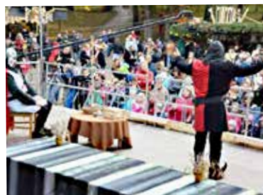
Otroška predstava Vitez Mali Bu