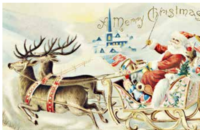
Božiček z jelenčki je ameriški produkt, ki je bil najprej omenjen v pesmi in ponazarja našega Miklavža (vir: http://www.goodhousekeeping.com/ )