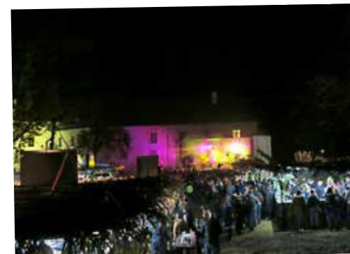
Grajski park v siju luči