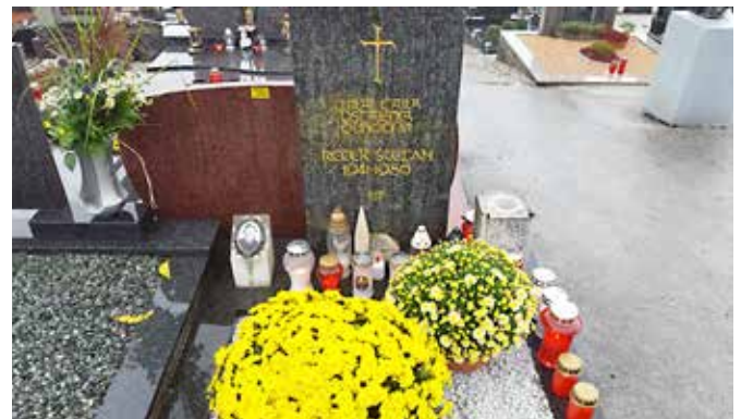
Grob Štefana Recka na Ponikvi