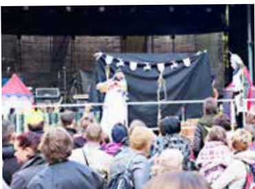
Kako je bilo življenje na gradu