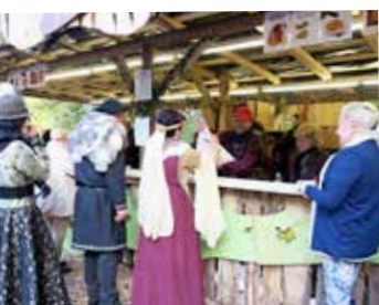
Pripravi dober žakel