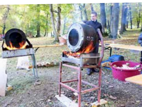
Kostanji so se vrteli