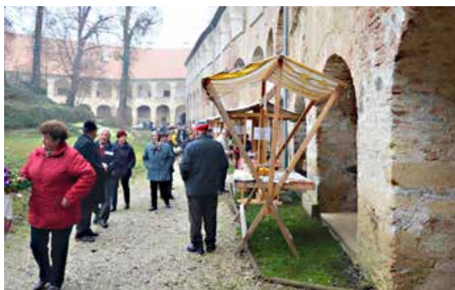
Andrejev sejem na grajskem dvorišču

je sledilo druženje in pogostitev Karitas Župnije Grad. Tako nas je dogodek popeljal v bližajoč se vesel, miren in pričakovanja poln praznični čas v letu.