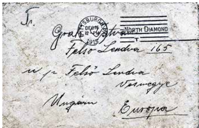
Kuverta iz leta 1915, poslana iz ameriškega Pittsburgha h Gradu, takrat Felsö Lendva