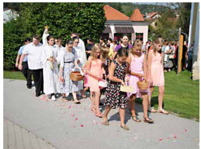
H Gradu je že drugič priromala fatimska Marija romarica