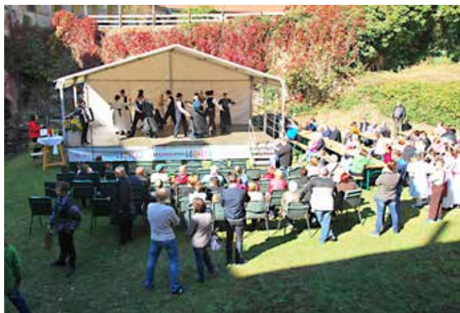
Kulturni program 11. jesenskega bazara