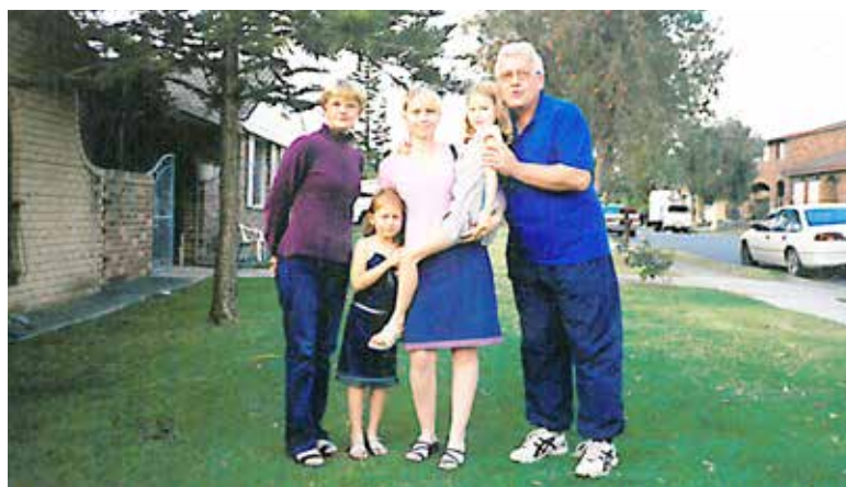
Pred domom v Avstraliji

Avstraliji. Srečevala sta se s politiki, gospodarstveniki, kulturniki, športniki in vsemi vrstami obiskovalcev iz cele Jugoslavije. Pridružili so se tudi Avstrijci in Italijani. Vsesplošno sodelovanje je tako obrodilo lepe sadove, na katere imata še sedaj zelo lepe spomine.