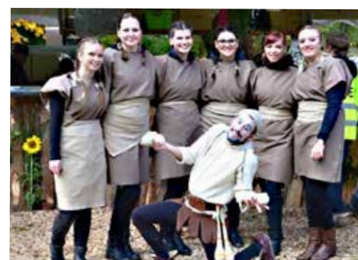
Dvorni zabavljač ob goričkih deklah