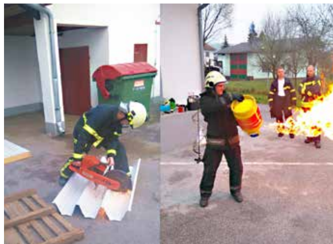
Prikaz novih načinov dela gasilcev

Eno izmed izobraževanj je bilo v soboto, 26. novembra 2016, na Dolnjih Slavečih, ki ga je organizirala Gasilska zveza Grad. Določili smo štiri različna področja taktičnega delovanja gasilcev: gašenje sončnih elektrarn, gašenje naftnih derivatov, gašenje ob požarih na strehah in gašenje dimniških požarov. V ta namen smo povabili štiri inštruktorje iz gasilske šole, ki so nam teoretično in praktično prikazali pravi in učinkovit pristop delovanja gasilcev v prej naštetih okoliščinah. Marsikom verjetno