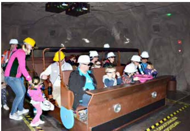
Obiskovalci so dobili posebno doživetje v globinah vulkana