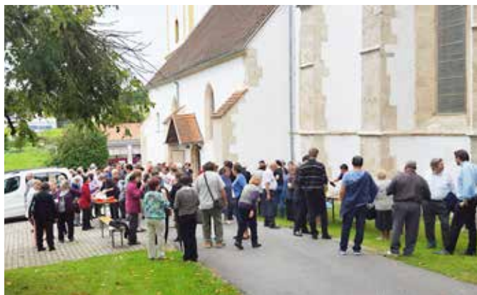
Druženje bolnih in ostarelih ob cerkvi z novo fasado