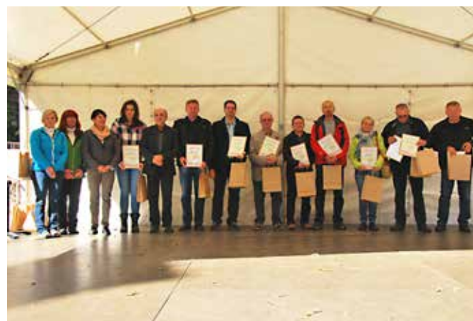
Novi prejemniki Kolektivne blagovne znamke KPG