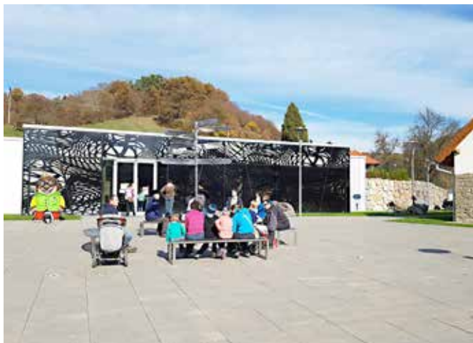
Obiskovalci so imeli dodatno ponudbo z delavnico v Lednarjevi usnjarni