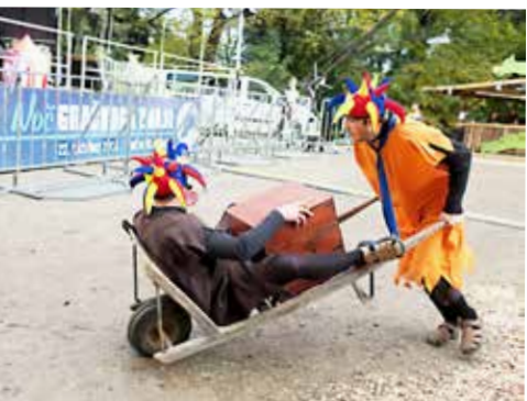
Dvorna norčka se zabavata