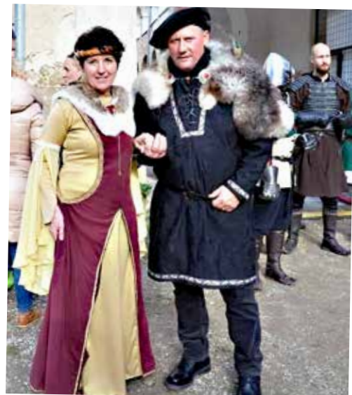
Grofica in grof