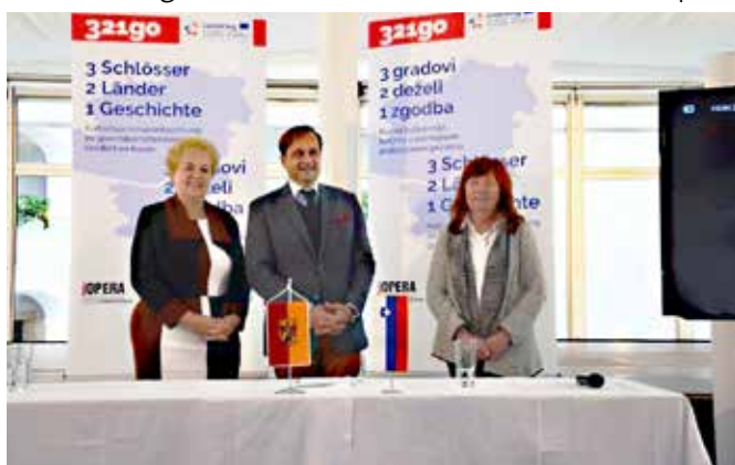
Tiskovna konferenca na gradu Tabor (Neuhaus am Klausenbach) v Avstriji

Glavni cilj projekta je oblikovanje trajnostne kulturno turistične destinacije z novimi kulturno turističnimi produkti na čezmejnem območju. Projektni partnerji so JO-PERA (grad Tabor) - vodilni partner, PMMS (grad Murska Sobota) in JZKPG (grad Grad). Glavni rezultati projekta bodo zgodovinska razstava na vseh treh gradovih, povezovalna zgodovinska družinska tura, izvedba skupnih