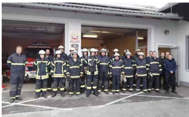
Gasilci na usposabljanju na Dolnjih Slavečih

ni jasno, da lahko naprave, ki so pod električno napetostjo gasilci gasimo tudi z vodo; vendar samo z ustrezno opremo in pravilnim pristopom, kar smo lahko tudi praktično preizkusili. Prav tako smo pridobili novo znanje pri gašenju utekočinjenega naftnega plina. Na področju gašenja streh so nam bili predstavljeni različni pristopi gašenja, z različnimi orodji smo preizkusili prežagovanje pločevinaste strehe. Tako smo tudi prvič preizkusili motorno žago, ki smo jo v letošnjem letu nabavili in je namenjena za rezanje različnih materialov in s tem učinkovitejšemu posredovanju naših gasilcev. Prav tako smo veliko novega izvedeli na področju taktike gašenja dimniških požarov. Pri tem je potrebno poudariti, da je osnova za preprečitev dimniških požarov ustrezen in čist dimnik, uporaba ustrezno suhih drv in pravilen način kurjenja. Inštruktorji so se zelo potrudili in so nam na strokoven in zanimiv način povedali in prikazali veliko novega. Vse skupaj je bilo zelo zanimivo, zato je sobotni dan bil hitro pri koncu. Udeleženci so odšli domov navdušeni in z novimi znanji pripravljeni priskočiti občankam in občanom na pomoč.