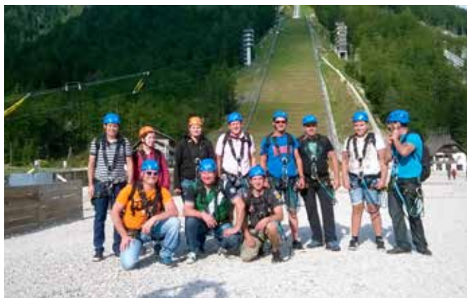
Pogumni člani ŠD Vidonci na zipline-u v Planici