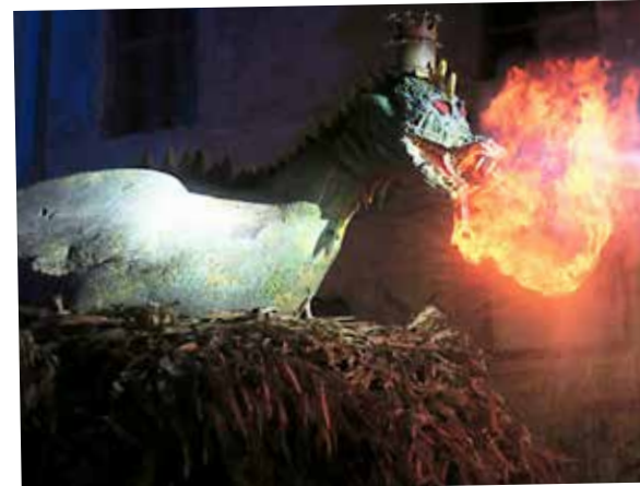
Zmaj se veseli krone