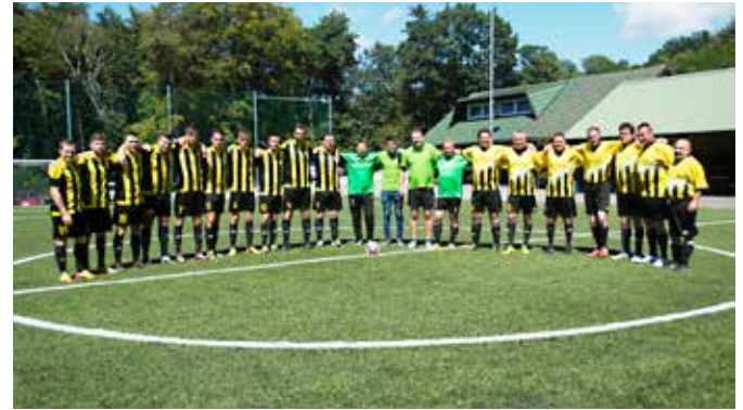
Nogometni ekipi Vidonci 1996 in Vidonci 2016