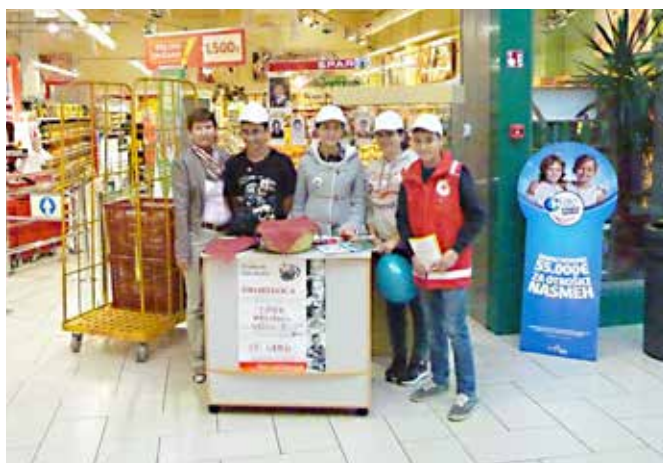
Stojnica učencev OŠ Grad v murskosoboškem Maximusu.