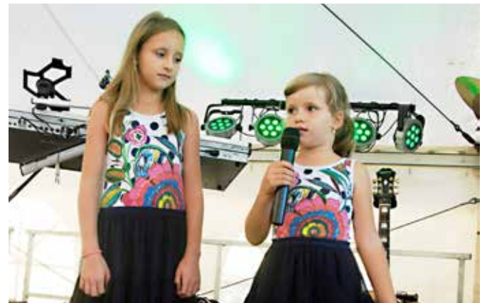
Utrinki s kulturnega programa