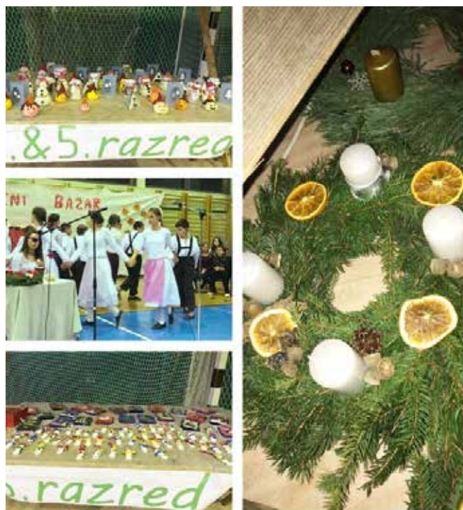
Nekaj utrinkov s 5. božičnega bazarja