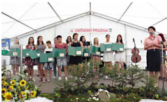
Uspešni učenci s prejetimi knjigami