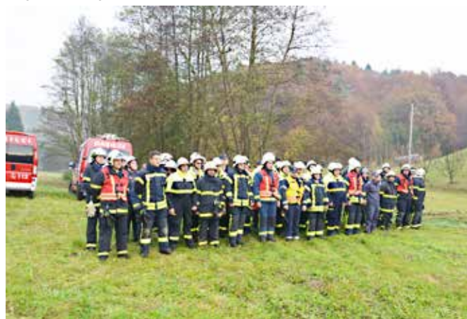
Gasilci na vaji v Vidoncih

Na vaji so sodelovala vsa gasilska društva GZ Grad z vsemi razpoložljivimi gasilskimi vozili, operativnimi člani in opremo, vključno s pomočjo in sodelovanjem ReCo M. Sobota. Namen gasilske praktične vaje je bil preverjanje gasilske taktike gasilskih enot pri postopkih reševanja in gašenja ter pravilnem rokovanju in uporabi gasilske reševalne in zaščitne opreme, gasilskih vozil in črpalk ter pravilna uporaba zvez pri komuniciranju na intervenciji ter pravilni postopek vodenja intervencije z vzpostavitvijo sektorjev.