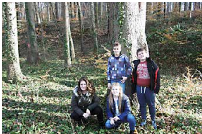
Za božični bazar smo nabirali storže in različne plodove

smo se robotske delavnice v Murski Soboti. Skupaj smo se učili in urili možgane.