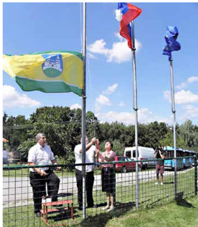
Zastava Občine Grad