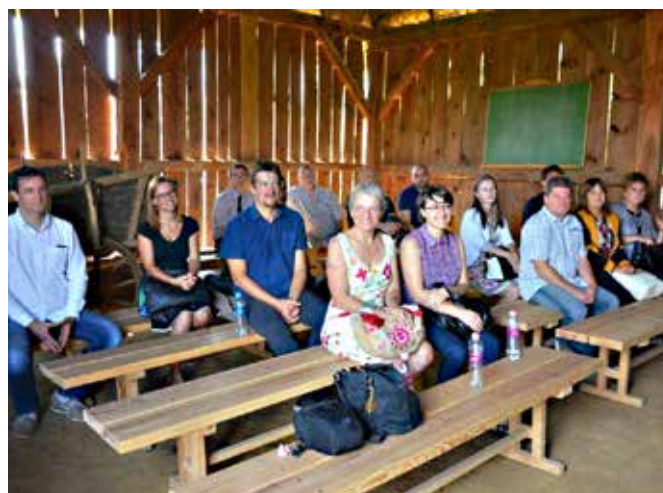
Tiskovna konferenca v Pityerszeru na Madžarskem