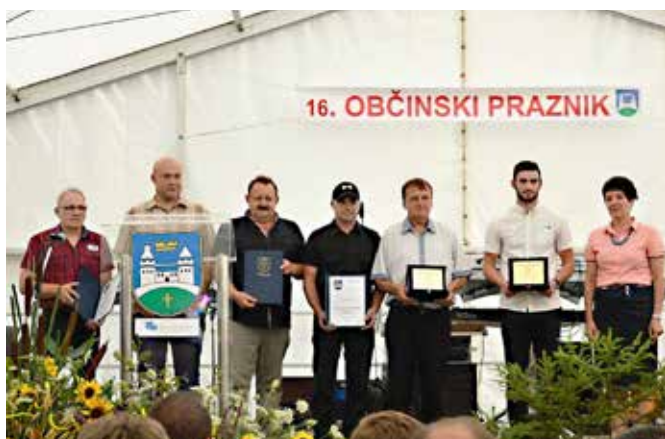
Dobitniki plaket in priznanj