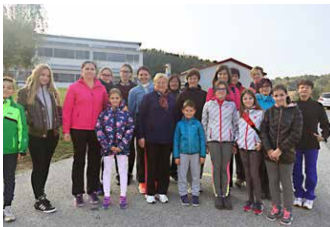
Za zdrav duh v zdravem telesu

Osnovna šola Grad sodeluje pri projektu Simbioza giba, ki je potekal med 10. in 16. oktobrom 2016. Namen projekta je druženje vseh generacij, predvsem pa gibanje, ki je potrebno v vseh obdobjih življenja. V tem času smo