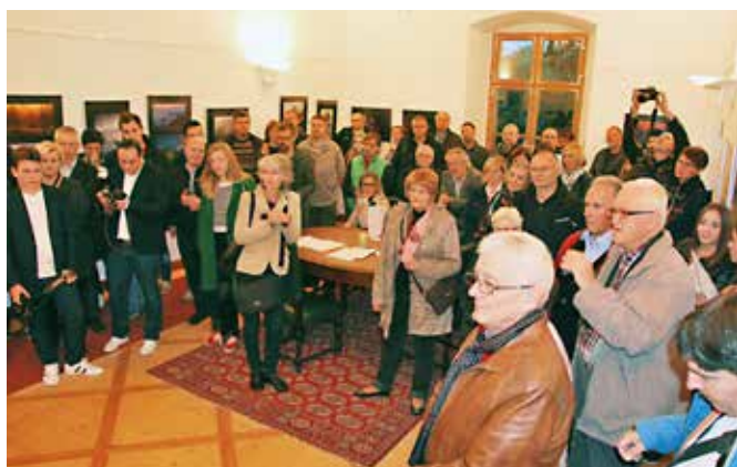
Odprtje razstave 4 dežel