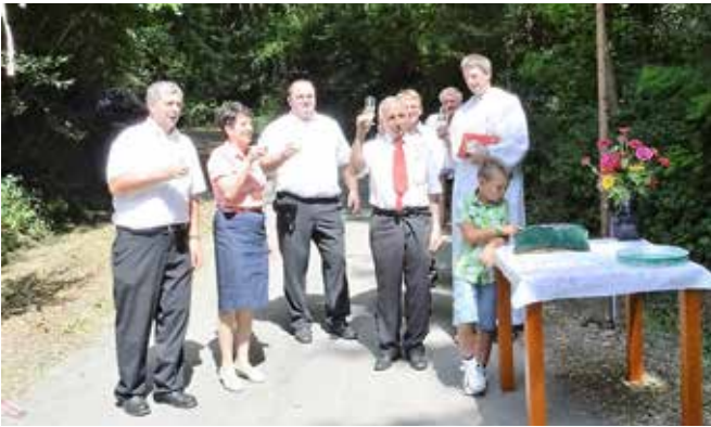
Otvoritev ceste Belik križ – Kuftovi