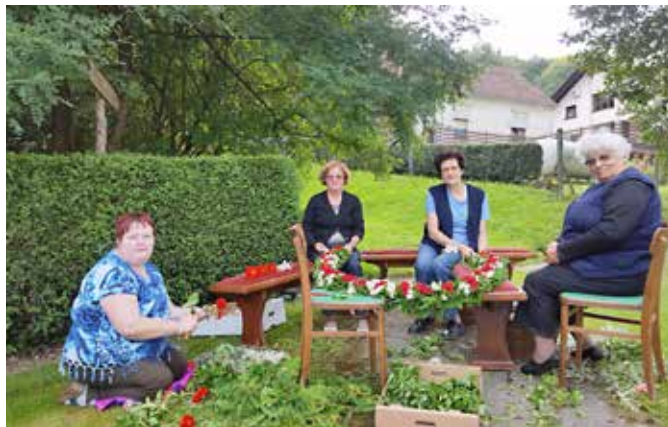
Pletenje vencev za vel'ko mešo pri Gradu