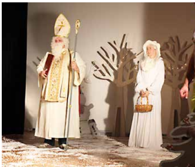
Miklavž je obdaril otroke v občini