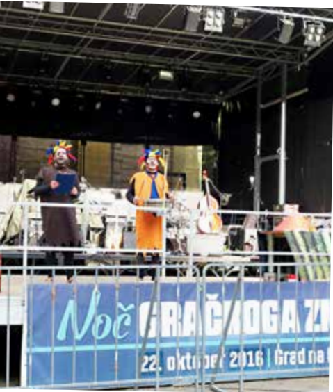
Noč gračkoga zmaja se začne