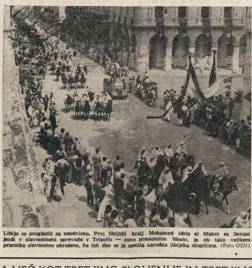
Libijo so proglasili za neodvisno. Prvi libijski kralj Mohamed Idris el Mahvi Es Senusi jezdi v slavnostnem sprevodu v Tripolis — novo prestolnico. Mesto, je od tako velikega praznika slavnostno okrašeno. Se isti dan se je sestala narodna libijska skupščina.

To besedilo se glasi: »Do-brine pravice in interese, ob-ostoječe v Italiji in dan uveljavljena priročne pogodbe in ki so pripadli bivšim italijanskim državljanom, bivajočim na STO, kateri so postali državljanji STO na podlagi te pogodbe, ki Italijo spoštovala v isti meri kot dolžne pravice in interese italijanskih državljanov v splošnem in tu do-vo breh let po uveljavljanju mirovne pogodbe. Kam na denemo to določilo sedaj, ko se že zdavnaj minula tri leta po uveljavljanju mirovne pogodbe, a o državljanji STO ni še duha ne sluha?« Jasno je, da se pod sen-mentalno pretvezo tržaške za-stave nameravalo pokreniti na cmenjeni seji tržaškega občin-skega sveta bolj resno vprašanje, ki naj bi s pravnimi ar-gumentii podprlo kampanjo proti izvajanju mirovne pogod-be v njenih določbah, ki se vi-čejo STO. Zato društvo »Pravnik« kot tolmáč pravnega četa slovenskega prebivalstva STO poziva ZVU naj, kot prvi vladni or-gan tega področja STO poskrbi za spoštovanje in izvajanje vseh že sedaj uporabljivih do-lobč mirovne pogodbe, zlasti čl. 6, 7 in 8 stalnega statuta. DRUSTVO «PRAVNIK»