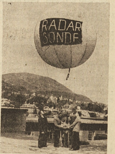
V okviru zanimive razstave zadnjih iznajdb na polju radarja razstavljajo tudi radarbalon. Ta radarbalon vsebuje popolnoma opremljeno vremensko postajo v minijaturi, ki jo spustijo v zrak, da ugotavlja vremenske pogoje. Te balone spuščajo v zrak z ladjami na odprtem morju.