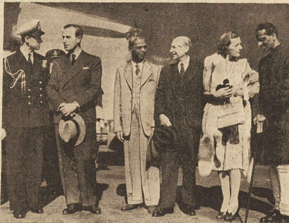
Bivši generalni guverner Indije, Lord Mounbatten, se je vrnil s svojo soprogo iz Indije v Anglijo. Na letališču Norholt so ga pri prihodu pozdravili: vojvoda Edinburški (levo), ministrski predsednik Attlee (v sredini) in Mr. Krishna Menon, visoki komisar za Indijo (desno).