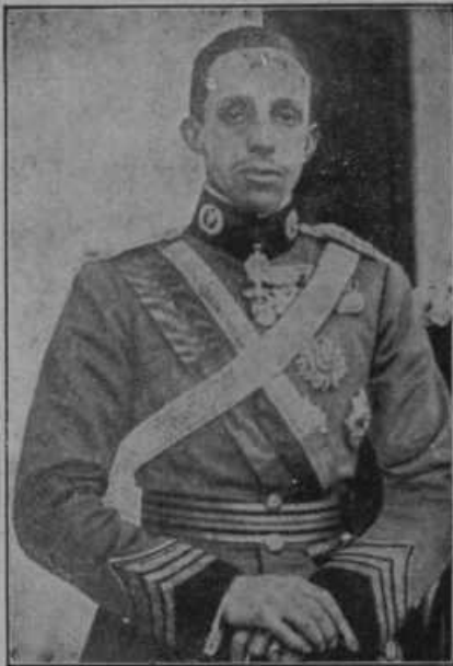
Španski kralj Alfonz je moral zapustiti Španko in oditi v inozemstvo, ker so republikanci dobili v deželi veliko premoč. Rojen je bil l. 1886. in je prevzel vladarstvo 17. maja 1902.