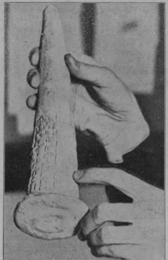
6000 let staro pismo. Čikaški raziskovalec prazgodovine je pri svojih izkopavanjih našel tako kamnito pismo v obliki stožca. To pismo je pisal v babilonskem klinopisu kralj Entemena iz Lagaša med leti 4000 do 3000 pr. Kr. r. nekemu prijatelju.