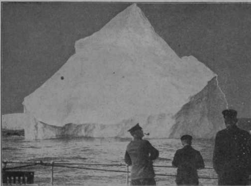
Ledena gora na oceanu. Daleč gori na severu, v večnem snegu in ledu se ob koncu pomladi odlomijo gore ledu. Morski toki ženejo te ledene gore proti jugu na odprto morje. V temnih in viharjih nočeh so take ledene gore velika nevarnost za ladje. Dne 15. aprila 1912 je trčil v tako goro parnik »Titanic« ter se je potopil in z njim 1500 ljudi. Tudi pozneje še se je potopilo mnogo ladij. Kakega zanesljivega sredstva za obrambo proti tem nevarnostim še niso našli. Tu pomaga še samo previdnost kapitanov in pomorščakov.