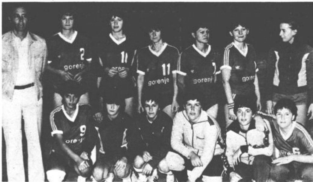
Letos v velikih denarnih težavah

V 4. kolu se bodo na domačem igrišču sestale z ekipo Ete iz Cerknega.