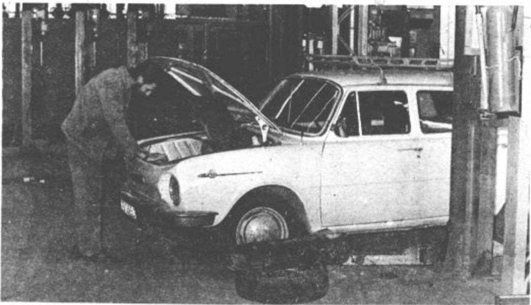
Vrata servisne delavnice so že odprli za vse občane, kmalu pa bodo opravljali tudi pooblaščen servise za vozila Zastava