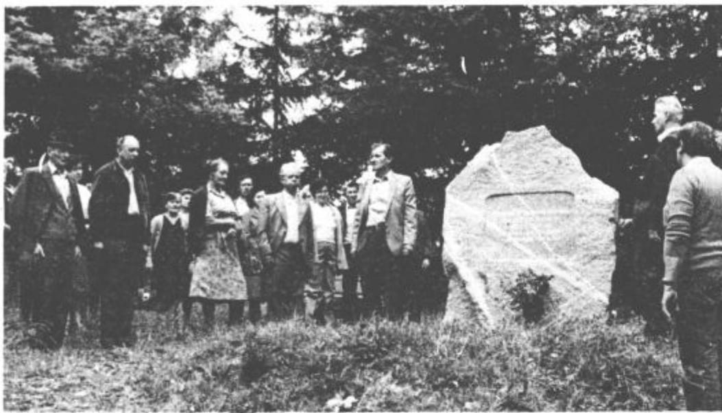
Poklonili so se spominu