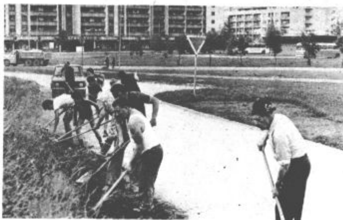
S prostovoljnim delom do razsvetljave

Naj še dodamo, da je izvajalec električnih del Elektrostrojna oprema, v gradbenem materialu je to akcijo podprla delovna organizacija HPH Velenje, Vegradov