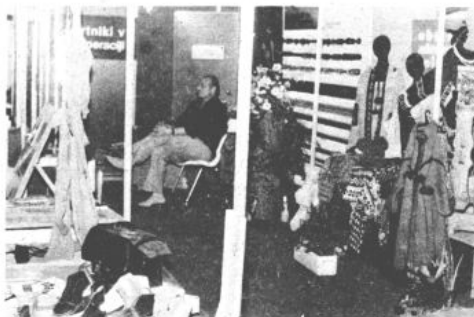
Del velenjskega razstavnega paviljona