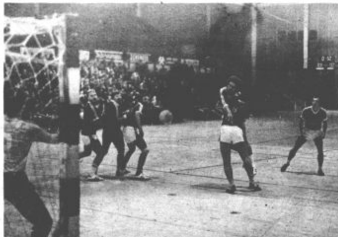
Potušek je bil nezadržljiv