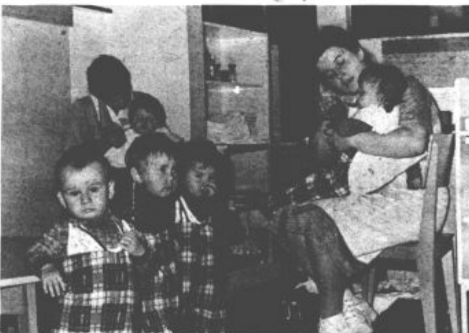
V jasličnem oddelku