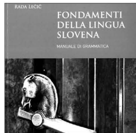
Znanje jezikov odpira nova vrata

Knjiga Fondamenti della lingua slovena zahteva seveda nekaj osnovnega slovnice znanja nasploh in v materinem jeziku. Ned-