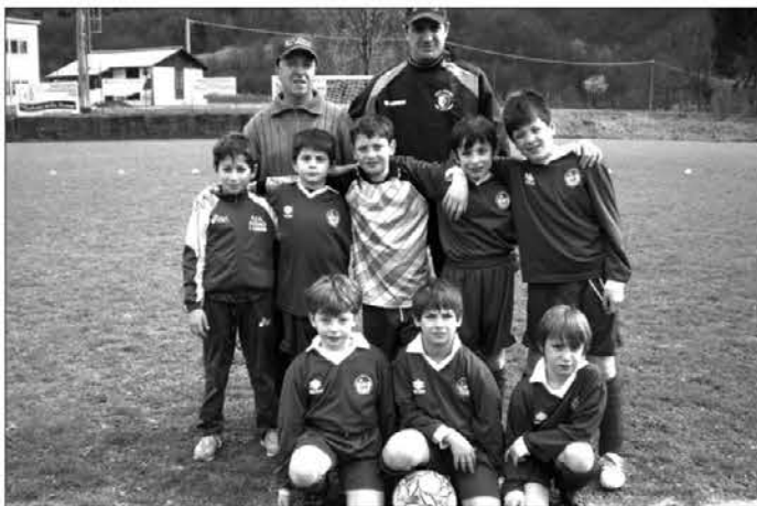
La formazione dei Pulcini dell'Audace di San Leonardo

Gli Juniores della Valnatisone dovevano affrontare l'Arteniese. Purtroppo con le squadre già pronte all'impegno, a mezz'ora dall'inizio si è scaricata sul terreno di gioco una eccezionale grandinata accompagnata da una copiosa precipitazione che ha reso impraticabile il terreno di gioco costringendo