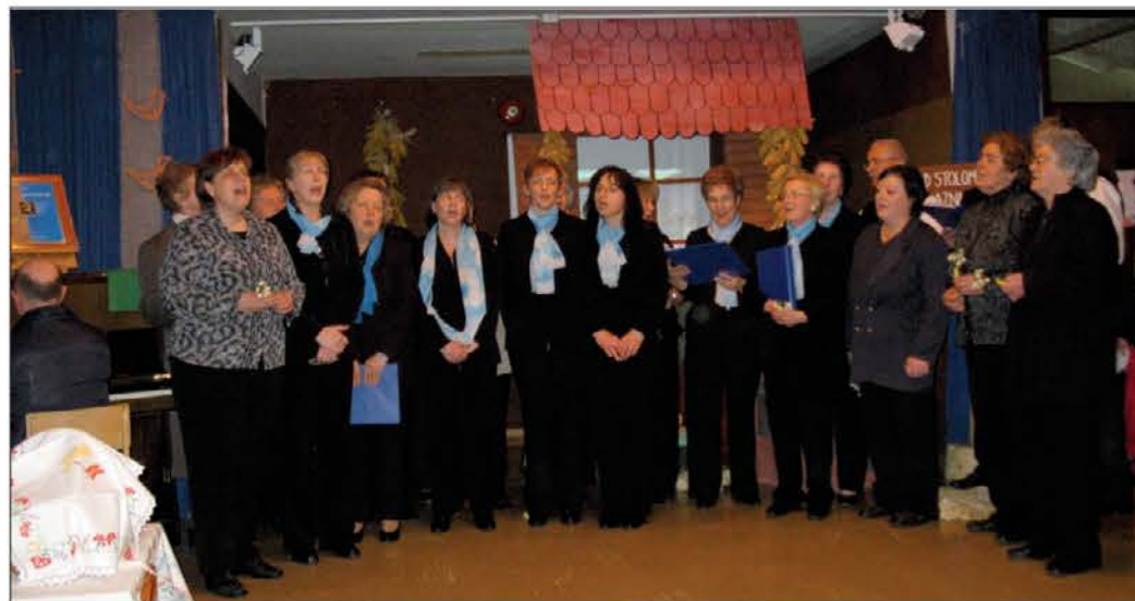
Pevska zbor iz Tipane in Breginje sta s skupnim petjem dodatno "segrela" številno publiko