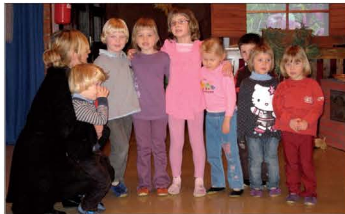
V pomladno prireditve so nas popeljali najmlajši