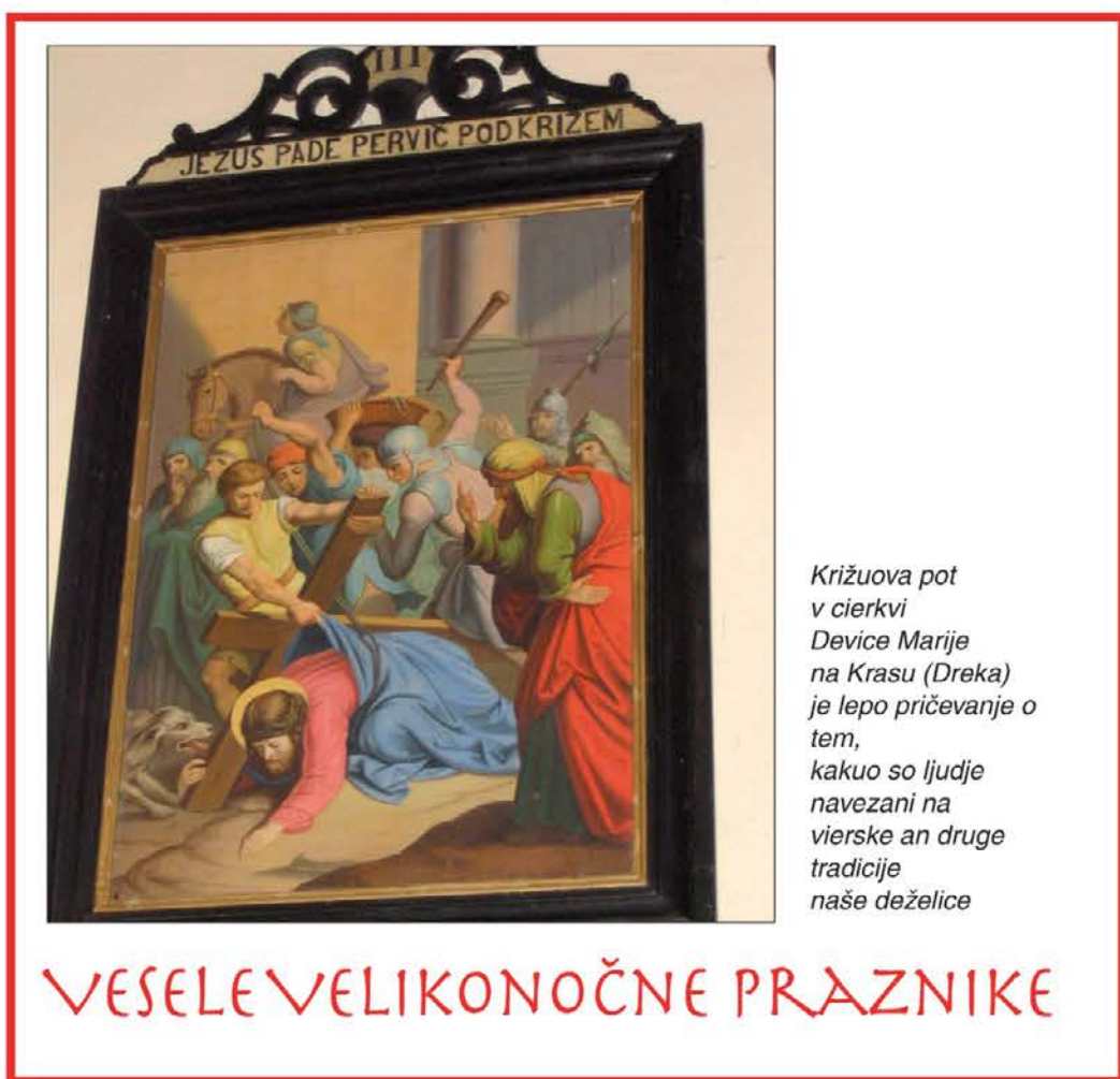
Križuova pot v cirkvi Device Marije na Krasu (Dreka) je lepo pričevanje o tem, kakuo so ljudje navezani na vierske an druge tradicije naše deželice