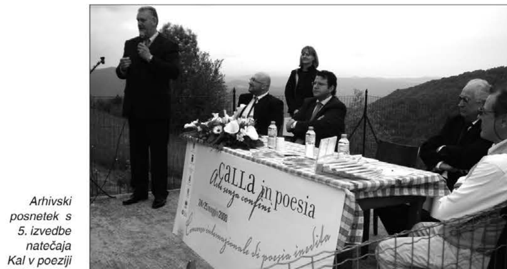
Arhivski posnetek s 5. izvedbe natečaja Kal v poeziji

Zato je možno na njem sodelovati s pesmijo (do 15 verzov), ki je napisana v italijanskem ali slovenskem jeziku (in njegovi narečni različici), od leta 2005 dalje pa še v tretjem jeziku, ki ga vsakič posebej določijo. V Podbonescu so se za to odločili, da bi se tako poklonili vsem rojakom, ki so se morali izseliti in so si zdaj ustvarili