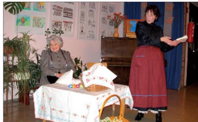
Za dobro voljo sta poskrbeli igralci iz Sedla

V pomladno prireditve so nas popeljali vrtničkarji,