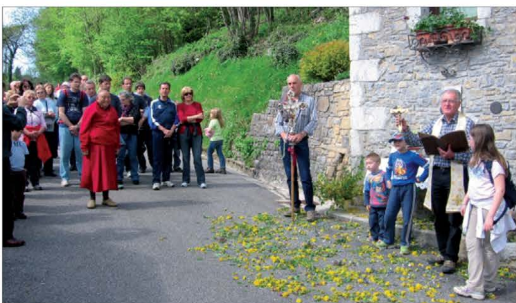
Čeglih tudi v saoujskem kamunu nie vič puno ljudi ku ankrat, vasnjani darže živo viersko navado rogacjonu svetega Marka na 25. obrila. Vsako lieto se zbere puno ljudi

na deset: šest moških an štier žene. Na 31.12.2009 je v Sauodnji živielo 521 ljudi: 271 moških an 250 žen. Še tarkaj slavo nie šlo ne, saj se je šlo na manj "samuo" za pet.