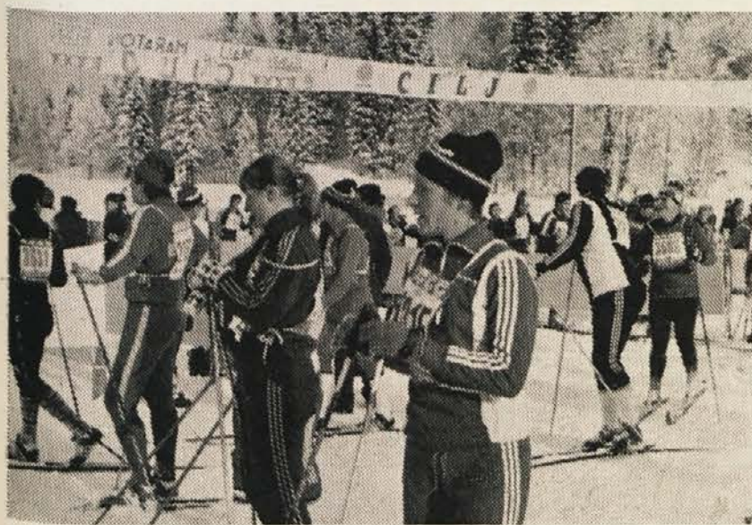
Na cilju VI. Trnovskega maratona

Za letošnjo prireditev pričakujejo organizatorji nastop okrog 4000 tekmovalcev iz Jugoslavije in inozemstva. Organizacijski komite je navezal stike tudi s Slovensko športno zvezo v Celovcu in z Zvezo slovenskih športnih društev v Italiji, tako da obe zvezi zbirata prijave za Trnovski maraton iz Avstrije ozi-