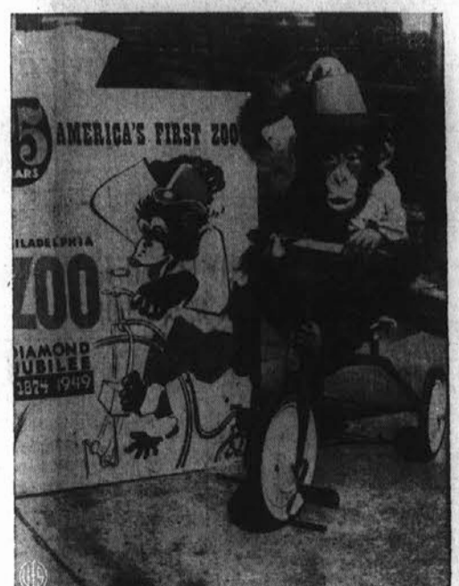
MONKEY SEES, MONKEY DOES—Pandora, the Philadelphia Zoo's chimpanzee, celebrates her second birthday with a tricycle ride. She's the zoo's special mascot for its 75th anniversary celebration because of her strong resemblance to the chimpanzee on the Diamond Jubilee poster, whom she imitates here.