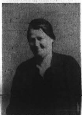
V BLAG SPOMIN ČETIRTE OBLETICE SMRTI NEPOZABNE SPOROCE IN SKRBE MATERE

"Ali pa morda možki: ne igrajo tudi vsak svojo vlogo?" me boš morda vprašal Zelo poredkoma; in kadar je, postanejo neznosni.