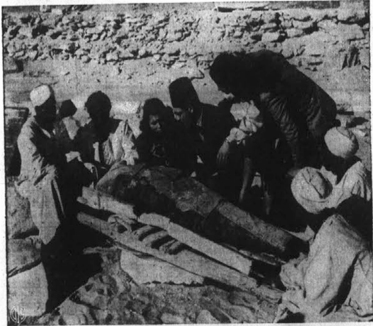
Študij v prosti naravi. — Slika nam predstavlja vseučiliško dijake z univerze v Cairu, ki študirajo starinoslovje v prosti naravi. Vidimo jih, ko si ogledujejo izkopanine, ki so jih odkrili pri odkopavanju 5000 let starega Zoserjevega templja v Sakkara blizu Cairu.