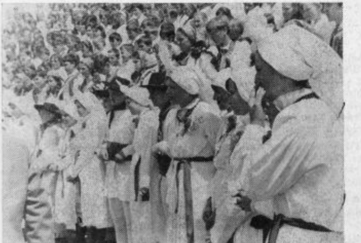
Belokranjska folklorna skupina je vzbudila pozornost z narodnimi plesi