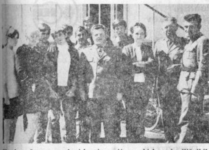
Skupina učencev z velenjske gimnazije na obisku pri miličnikih