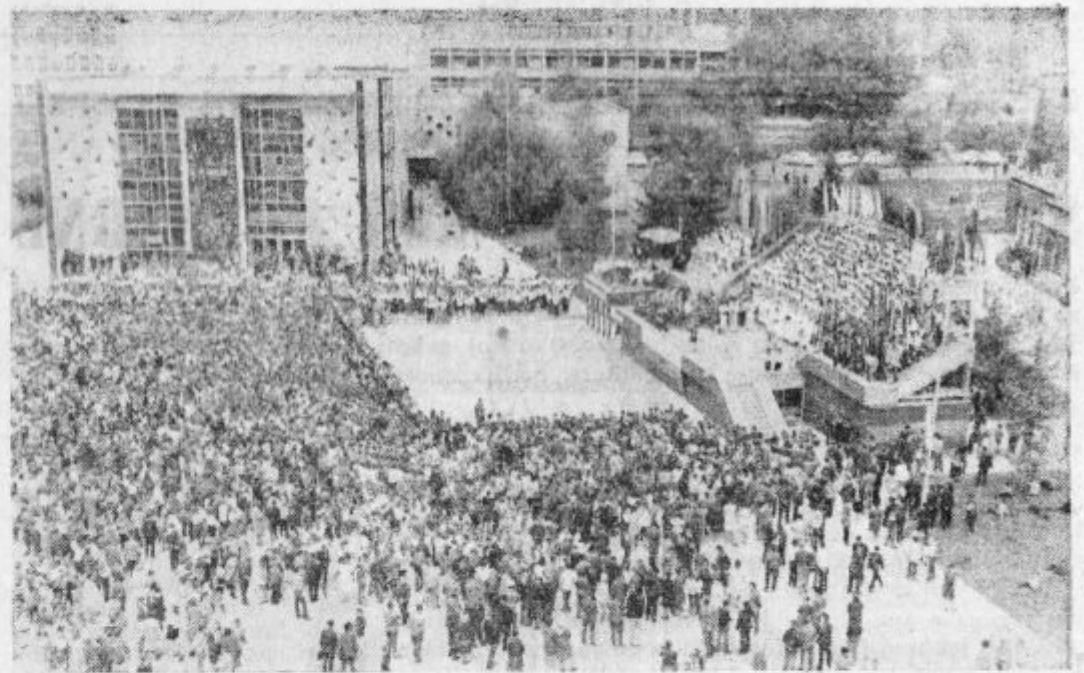
PIONIRSKA ŠTIRINAJSTA UDARNA DIVIZIJA V VELENJU

Srečno in na mnoga leta, dragi naš tovariš Tito!