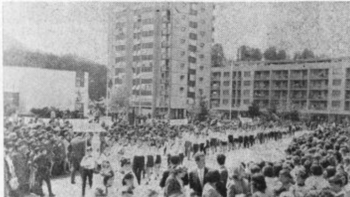
Delegacije pionirjev iz petnajstih občin so sestavljale pionirsko 14. divizijo. V ospredju je skupina iz Velenja

Srečanje v Velenju o ostalo pionirjem v nepozabnem spominu, saj je bil celotni spored skrbno pripravljen. Prizrčno je bilo gledati in poslušati pionirje, s kakšno zavzetostjo so sodelovali v pestrem kulturnem sporedu, ki je sledil prvemu delu prireditve na Titovem trgu v Velenju. Pionirji so izvedli recital, ki je ponazarjal borbeno pot in težke razmere, s katerimi so se na pohodu spoprijemali borci 14. divizije. S pesmijo in glasbo pa so pionirji pokazali svojo trdno odločnost, da bodo vedno sledili ciljem naše socialistične domovine. To pa so simbolizirali v refrenu velenjskega srečanja, ko so zapisali: »Ljubimo domovino« in »Mir otrokom sveta.«