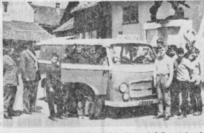
Učenci z osnovnih šol so si z zanimanjem ogledali postajo milice v Šoštanju