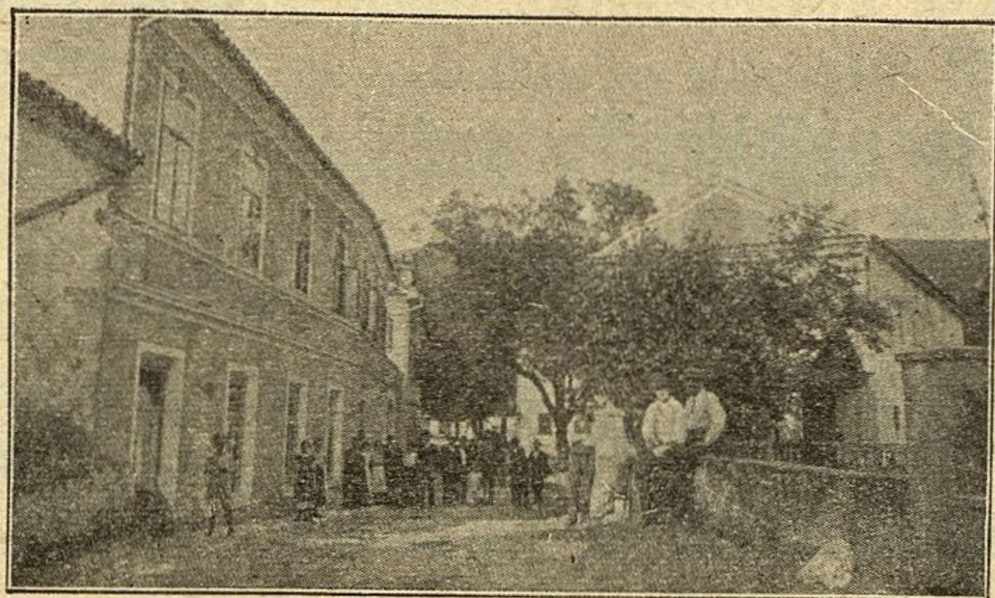
Gostilniški vrt s prijazno utico.