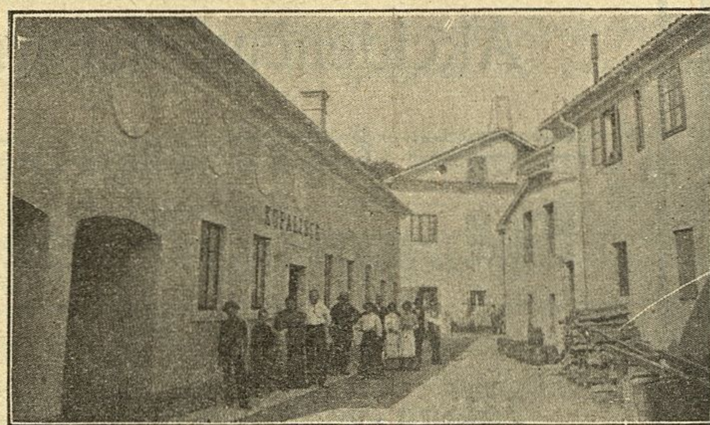
Najnovejše moderno opremljeno kopališče tik hotela.