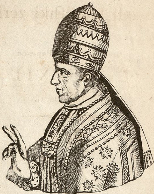
Leo XII. Pont. Max.