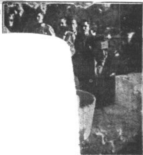
za SKJ br. Gangl tino v temeljni ka