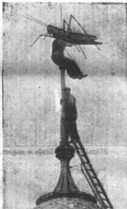
KOBILICA NA STOLPU. Na stolpu londonske borze se ne vrti vremenski posvetnik, marveč kobilica. Postaviti jo je dal tja sir Thomas Gresham, eden največjih angleških finančnikov.