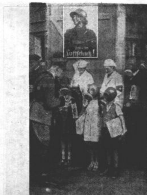
NEMOLJA PRESKRBUJE SVOJE PRADE VALSTVO Z LJUDSKIMI MASKAM. PROTI STRUPENIM PLINOM. So šolski otroci se morajo naučiti, kako se ta maska uporablja.