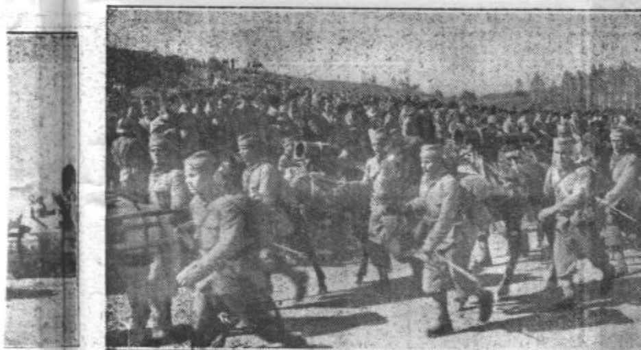
Mitraljezi defilirajo v naglem pohodu