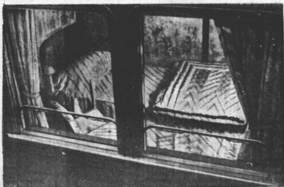
SALONSKI VAGON VODITELJA FAŠIZMA. Italijanski min. predsednik in vodja fašizma Mussolini se je pripeljal iz Italije v Nemčijo v oklopnem vagonu, ki je na vseh straneh obdan z jeklenimi ploščami. Na pritisk gumba jeklene plošče zakrijejo vse odprtine. Na sliki: Pogled v spalni oddelek Mussolinijevega voza.