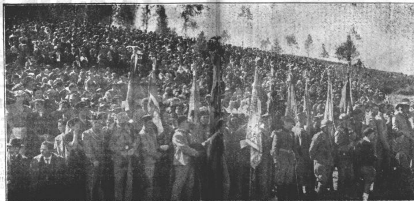
Pogled na del velike množice, ki je v Metliki prisostvovala manjšadi naše vojske. Prišlo je tudi več sto Sokolov v krojih in s prapori. Del sokojskih praportov se vidi v ospredju naše slike