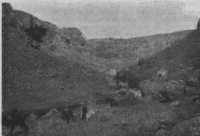
Misijonar na potovanju v deželi Bazuto.