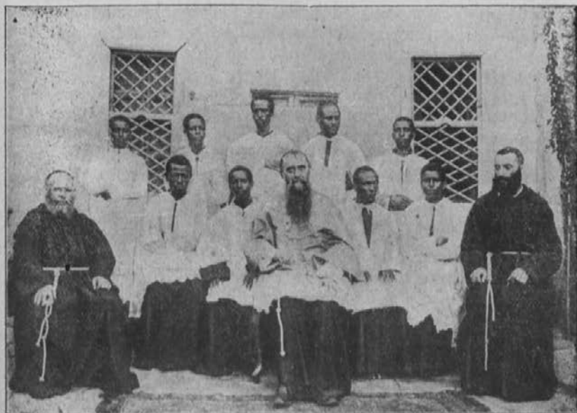
Skupina seminaristov iz Hararja v deželii Galas.

Toda ne moremo se tudi obraniti ãuta ponižnega priznanja, da nas je previdnost božja doloãila takorekoã