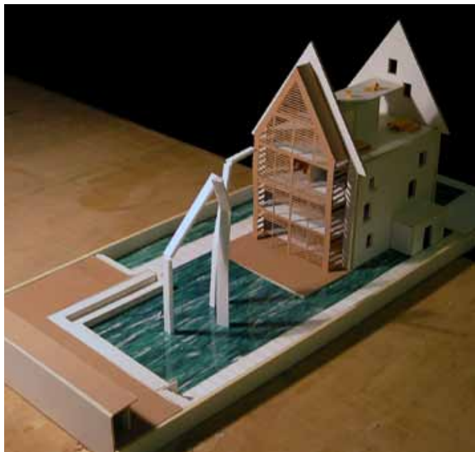
Slika 2: Projekt "Sodobna družinska hiša" [Nina Štrovs].