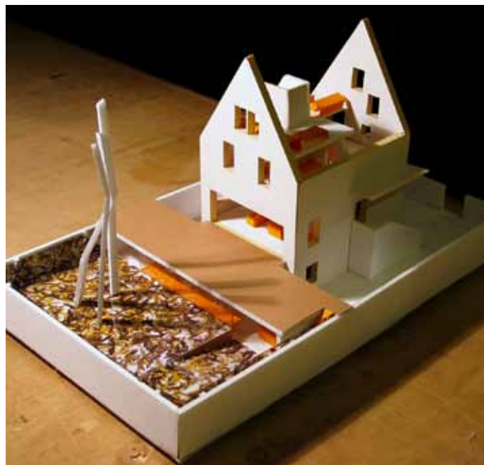
Slika 3: Projekt "Dom za več generacij"[Nina Kern].