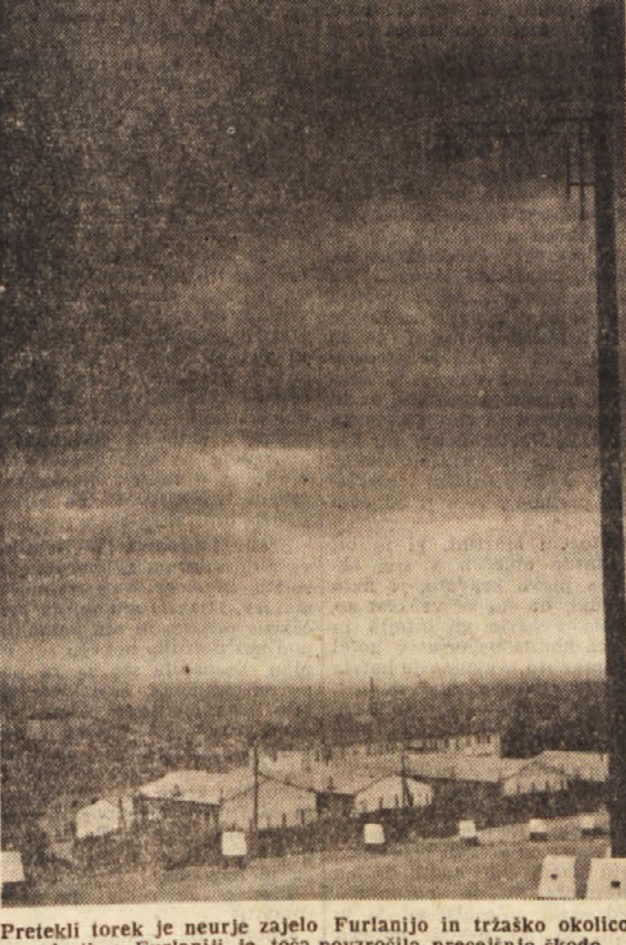
Pretekli torek je neurje zajelo Furlanijo in tržaško okolico, zlasti v Furlaniji je toča povzročila precejšnjo škodo

Jutri se bo v Tokiju vršila slovesna poroka med prestolonaslednikom Akihito in Mičiko Šodo. Tako se bo v 26 stoletjih zgodilo prvič, da bo japonskem prestolu cesarica meščanskega porekla.