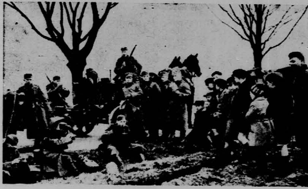
Slika je bila posneta v bližini Kolina ter predstavlja skupino nemških vojakov, ki se bodo po kratkem počitku odpravili proti francoski meji.