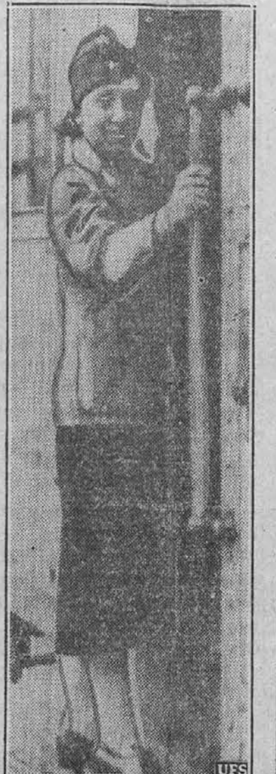
V Nemčiji, kjer je že milijone mož v orožju, so pričele v različnih policijskih nadomestiti moške. Na sliki vidimo nemško mladenko v Berlinu, ki je uslužbena kot sprevednica pri polični železnici.