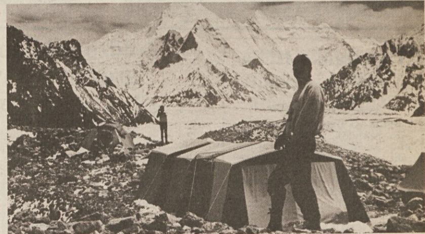
Morda pa bo jutri le nastopilo lepo vreme...

Podam se na kratko pot po ledeniku. Sprašujem se, kdaj me bo na tej odpravi doletel občutek sreče. Na vrhu Broad Peaka, če ga slučajno dosežem, ne, saj je to umetno ustvarjen cilj. Morda ob kakem tihem pogovoru ko pada mrak, ki se počasi in nežno razlije po vsej dolini ali pa na kakšni poti, ko se bomo pod večer vračali k izhodišču in bomo molčali, ker se bo narava razbohotila okoli nas in bo ona govorila v našem imenu. Morda pa tudi, ko se bo po dolgih dneh morečve megle prikazalo sonce in se bo v dišečih žarkih razlilo po zraku in