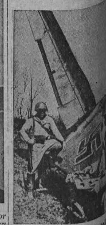
Na sliki je nemško letalstvo, ki je sestrelilo ruski letalnik. Poleg ruševine stojita dva vojaka.