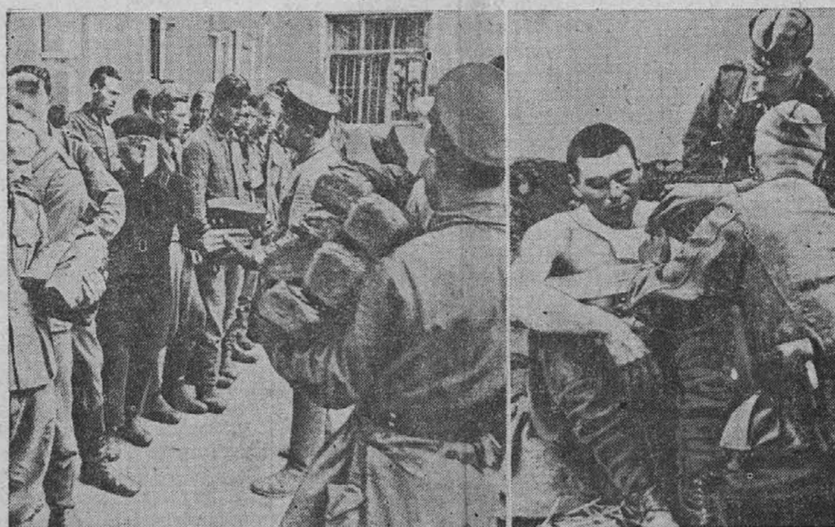
Slika na levi prikazuje nacistične ujetnike v ruskem taborišču, ko jim Rusi delijo hlebe kruha. Na desni pa vidimo dvojico nemških vojakov, ki dajeta ranjenemu Rusu prvo pomoč. Obe poveljstvi, rusko kakor nemško, radi razpošljata take slike v svet.