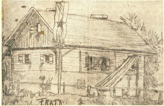
Partizanska koca na Frati

Bliža se konec lepih dni na Frati. Otroci žele, da bi še