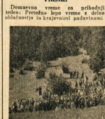
Prebivalci Loškega potoka so slovesno proslavili svoj prvi občinski praznik dne 31. julija. Na sliki jih vidimo pri odkritju spominske plošče osemnajstim talcem v Sodolu

VREME Domnevno vreme za prihodnji teden: Pretežno lepo vreme z delno oblačnostjo in krajevni padavinami.