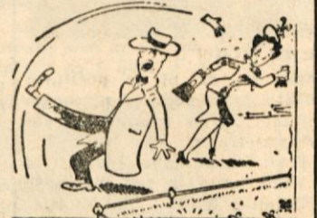
Nogometas: »Tovarišica, izgubila ste rokavico!«