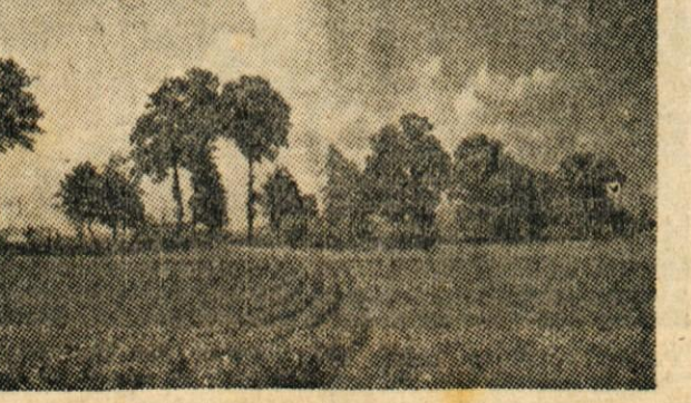
Krompir bo letos bogato obrodil