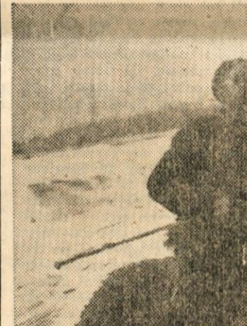
Suha krajina si že dolgo želi železnice in drugih prometnih zvez, kar pa je še vedno le pobožna želja. Vendar, za navadne »čiste« državljane še gre nekako. Mnogo težje je za dimnikarja... Na avtobus ga nemarajo, ker je umazan, na tovorni avto ne sme, ker je živ tovor, ti pa smejo prevažati samo mrtve tovor. Pa si je mislil britnji žužemberški dimnikar: »Eskimi so si okrotili za svoje prometno

brezposelnih, katerih število pa se še vedno veča. Amerika jim je sicer mnogo pomagala, saj so bili že popolnoma pri kraju in grozila jim je že lakota, vendar pa je ta pomoč vsako leto manjša in bodo letos dobili samo 20 milijonov dolarjev, dočim so jih prva leta po vojni prejeli letno okrog 300 milijonov. Sedaj so Grki skoraj popolnoma odvisni sami od sebe in je vprašanje, kako bodo v nadaljnjem uredili svoj gospodarski položaj. Vlak hiti naprej in kmalu smo na postaji Oebe, zopet znanome ime iz zgodovine. Spominjamo se tudi še znamenitih Termopil, ki so v bližini. Od teh do Aten imamo še dve uri vožnje. Okolica Teb je zelo rodovita. Imamo vtiš, da so hiše čiste, saj so v večini lepo pobeljene in na nekaterih oknih smo videli cvetlične lončke, zavite v bel krep-papir. Sonce vedno bolj pripeka, vsi smo priklini in opazujemo okolico. Kmalu zapazimo v daljavi Akropolis. (Nadaljevanje pride.)