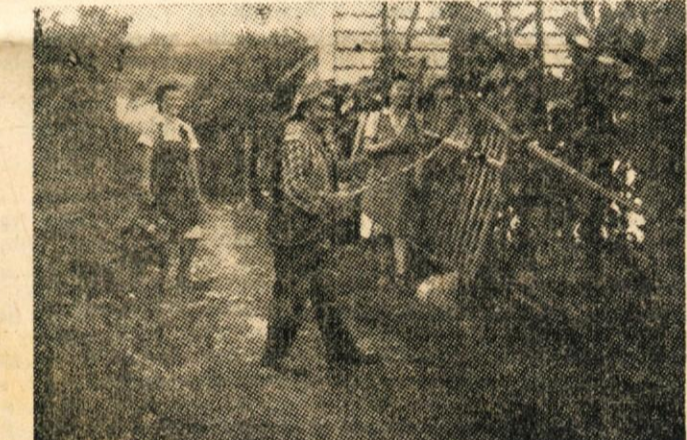
Belokranjci skrope trtje, čeprav vedo, da jim letos ne bo obrodilo. — Treba je...

Vrnimo Slovenskemu Primorju obisk v Dolenjskih Toplicah! Organizacije SZDL in sindikalne podružnice vseh dolenjskih okrajev sprejemajo prijave. V Slovensko Primorje bodo vozili posebni vlaki, zato naj ne bo kolektiva, ki bi se po delegatih ne udeležil tega zgodovinskega praznika in na dolenjske vasi, ki bi ne izkoristila redke prilike, da manifestira bratstvo in ljubezen do naših bratov onkraj meje in bi ne poslala svoje zastopnike na ta največji praznik primorskega ljudstva!