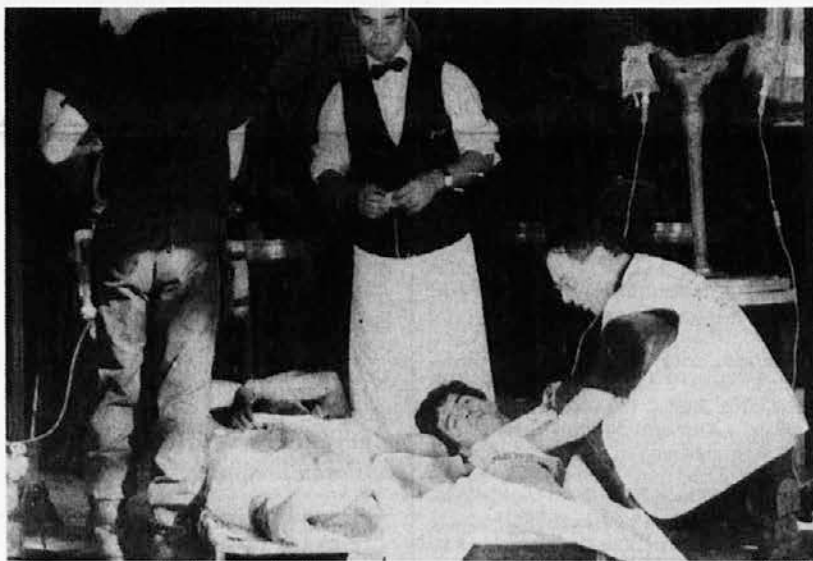
V torek, 25. t.m., je ob 17.30 eksplodiral peklenjski stroj v podzemni železnici v Parizu. Sedem oseb je bilo mrtvih, 60 jih je bilo ranjenih, od teh se jih 14 bori s smrtjo. Predsednik Chirac je izjavil, da »Francije ne bodo ustrašovali krvniški podleži.«