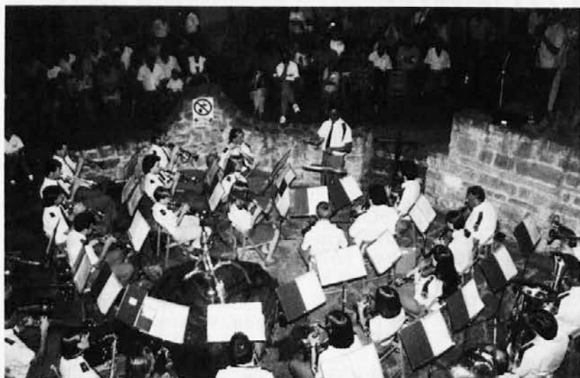
Na K'luži v Dolini so člani Godbenega društva Prosek-Kontovel imeli koncert ob praznovanju 100-letnice Pihalnega orkestra Breg

Pihalni orkester »Breg« praznuje letos 100-letnico obstoja in bogatega delovanja. Za to pomembno praznovanje so si člani pihalnega orkestra zamislili in tudi uspešno izvedli niz koncertnih prireditev po breških vaseh in povabili štiri godbe, ki delujejo v slovenskih vaseh na Tržaškem.