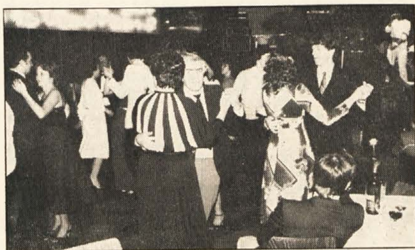
Tradicionalni Slovenski ples je bil tudi letos velik družabni dogodek koroških Slovencev na začetku novega leta. Zastopniki Slovenske prosvetne zveze so v celovškem Domu sindikatov pozdravili številne rojake iz vseh južnokoroških dolin ter mnoge vidne predstavnike družbenega življenja iz Slovenije, Primorske in Kanalske doline ter Koroške.

[O priveditvi obširneje poročamo na 3. strani.]