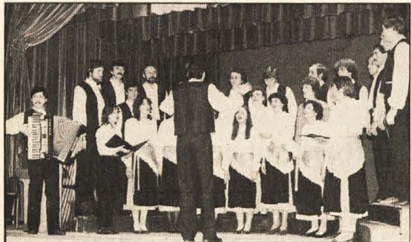
MePZ SPD „Rož“ iz Šentjakoba v Rožu