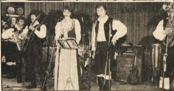
Za dobro glasbo sta skrbela „Modrina“