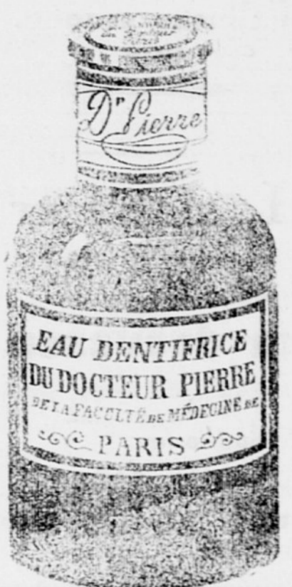
Zdravstvenoslavna ustna voda. Dobiva se povsod. 3661-14

GRAND PRIX Pariške svetovna razstava 1900.