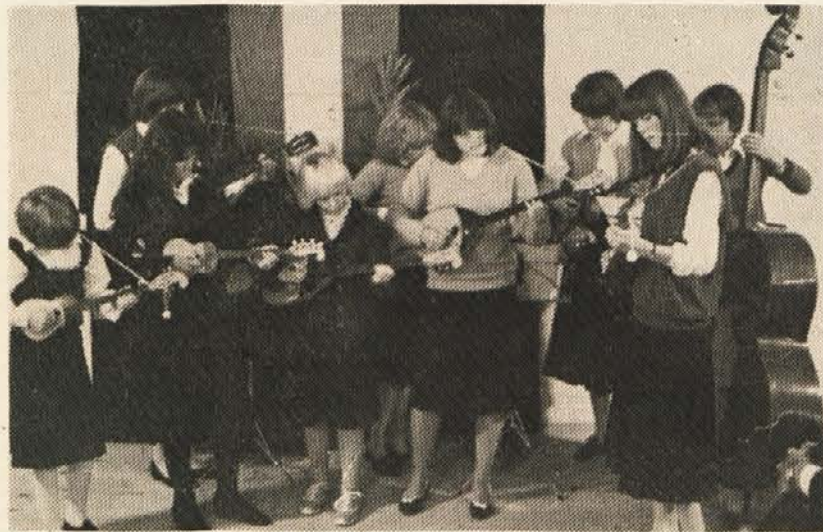
Tamburaški zbor SPD Šentjanž