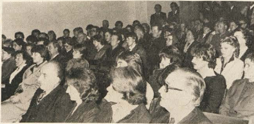
Del občinstva v Železni Kapli

otroci slovenskih staršev in to v hiši, katero povsem vzdržujejo iz davkov vseh prebivalcev — tudi slovenskih. Tako početje, je menil