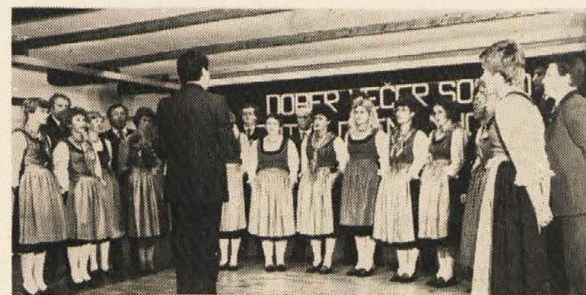
Mešani pevski zbor iz Grebinja

Upajmo, da bo vzajemnost, ki je vladala na prireditvah ob avstrijskem državnem prazniku v kulturnih dvoranah, našla zgled tudi v vsakdanjem življenju južne Koroške.