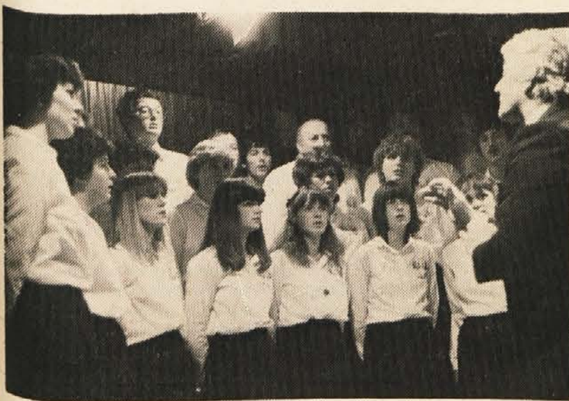
Mešani pevski zbor SPD „Srce“ v Dobrli vasi

ljudje vsi enaki, vendar se Slovenci na Koroškem razlikujemo v tem, da se moramo stalno boriti za naš narodni obstoj in za svojo materino besedo, za obstoj slovenske kulture. V nemškem delu svojega govora pa je še posebej omenil velikovški primer, ko so prepredili, da bi v tamošnji mestni hiši nastopili