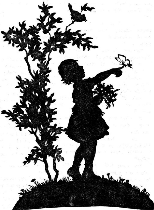
Deklica in metuljček

Vsakomur zacvete nagelj po volji Gospodovi, a po želji Sinovi cvete le nekaterim. In tistim ga Duh vedno znova napaja s svojo roso, da cvete rdeče kot kri človeškega srca.