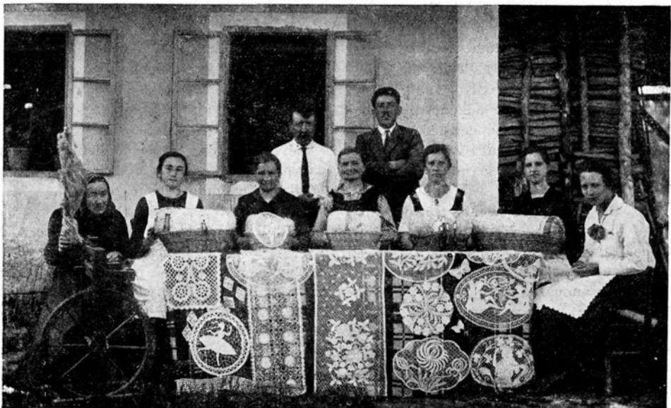
Klekljarice v Žireh

Mimo sta šla fant in dekle. Držala sta se za roke, si gledala v oči in se smejala. Nista govorila, a vedela sta vse; iz srca v srce so se jima pretakale misli.