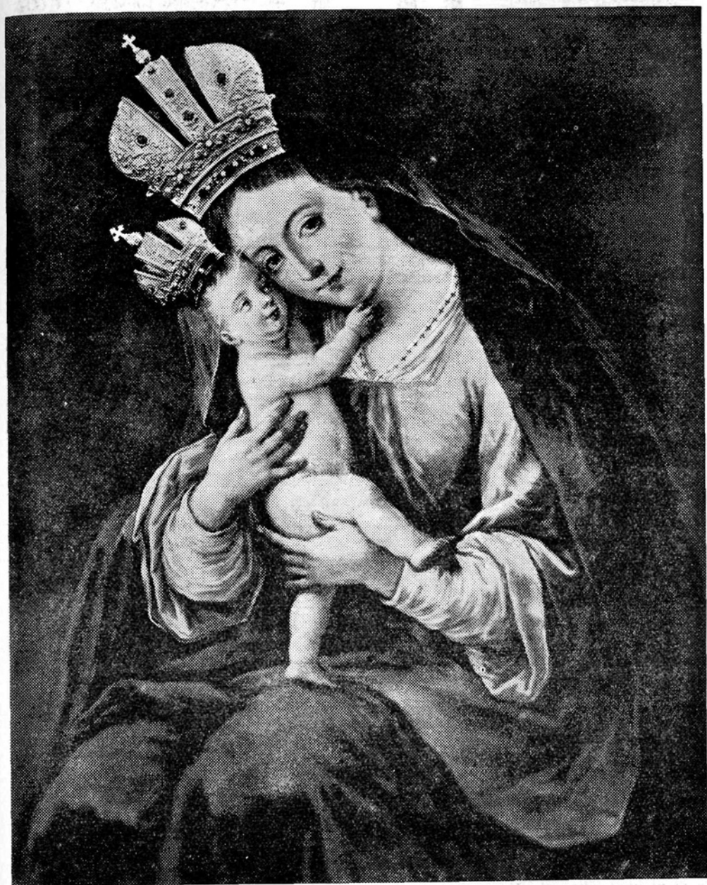
Mati božja z Brezij