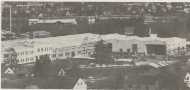
Streha nad novim delom perutninske klavnice