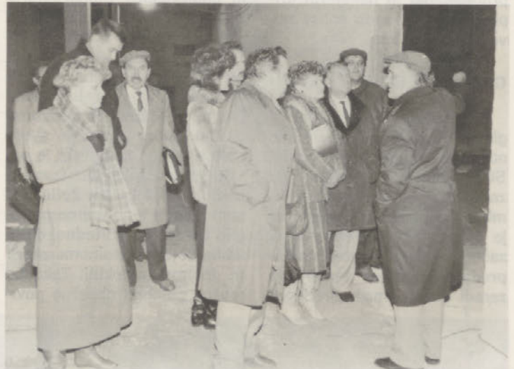
Po seji poslovnega sveta ogled gradbišča na perutninski klavnici

Investicijski program predvideva le okvirno število kadrov za nove tehnologije. Sredstva niso predvidena niti podrobnosti zahtev po specializaciji. To je naloga vodstva klavnice in podjetja. Na probleme je potrebno opozoriti, saj bo nova opremljenost na visokem nivoju tako strojne mehanike, kot elektronike in tudi mikroprocesorskega krmiljenja v nekaterih fazah. Prav tako bodo nove tehnologije v perutninski klavnici, v izkoščevanju, pakiranju, tehtanju, proizvodnji POM. Zahtevna bodo vzdrževalna dela na opremi, na klimatih, na pridobivanju