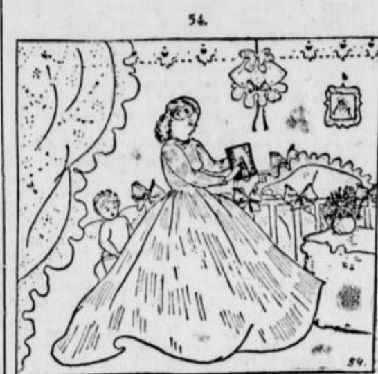
ANGELČEK JE LETEL K DOMACI HISI. TIHO JE SEDEL NA OKNO, DA VIDI LJUBLJENO MAMICO, KI NEPRENEHOMA ZALUJE ZA NJIM.