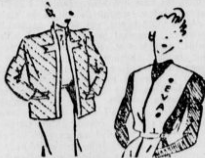
Dva primera jopic; prva je prešita kot odeja, druga ima prišit mufl. Obe sta primerani za delo v hladnih sobah.

(Piše vojni poročevalec v listu »Der Neue Tag«.)