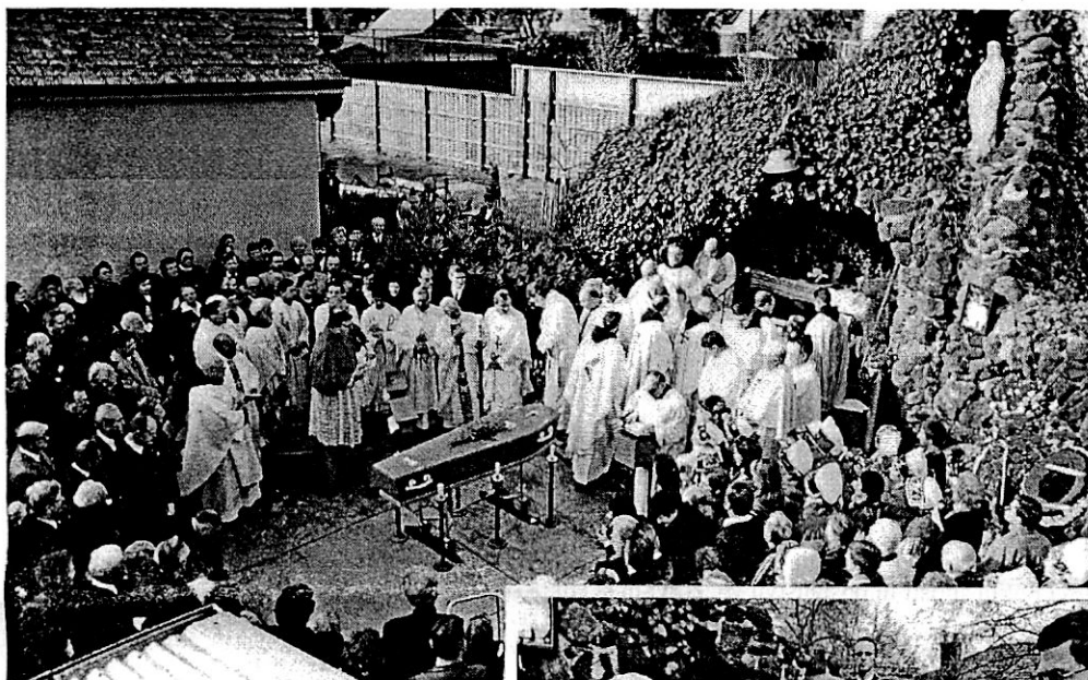
Pogrebna sveta maša pred lurško votlino v Kew