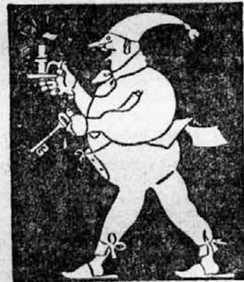
DARMOL najboljše odvajalno sredstvo

Igračke so pa tudi zato nevarne, ker toku venomer padajo iz rok na tla. Matji se stokrat na dan pripogne in igračko pobere, jo obriše ob krilo ali v predpasnik in vrne otroku. Le redkokdaj pa igračko tudi umije, da ne govorimo o topli vodi in milu,