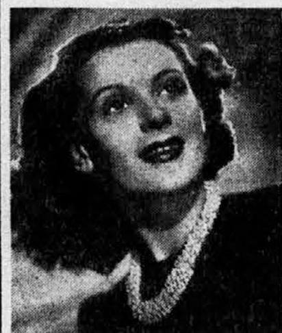
Aparna ogrlica, ki jo nosimo k preprostim temnim oblekam.

Kajpak je tudi otrokov organizem ustvarjen tako, da otrok marsikatero bolezen že v okužbi preboli, ni redko pa, da se otrok prav tako okuži. Po tleh je izredno mnogo nesnage — tudi na videz po čistih tleh, ker jo ljudje prinesejo v sobo s čevlji. Marsikdo, kj pride k otroku na obisk, zanese razne škodljive bakterije osredno iz okuženega kraja domov, otroku pridejo bakterije skozi usta najprej do malega jezička in goitanca, nato pa v telo, na koži pa skozi kakšno razpoko naravnost v kri. Kjer se ne pokaže takoj bolezen, pa večkrat otečajo bezgavke, naravne branilke organizma. Zato ima otrok včasih na lepem vnete zleze ob vratu, med nožicama, pod pazduho. To sicer ni tako nevarno, toda znak zdravja pa tudi ni. Ko orga-