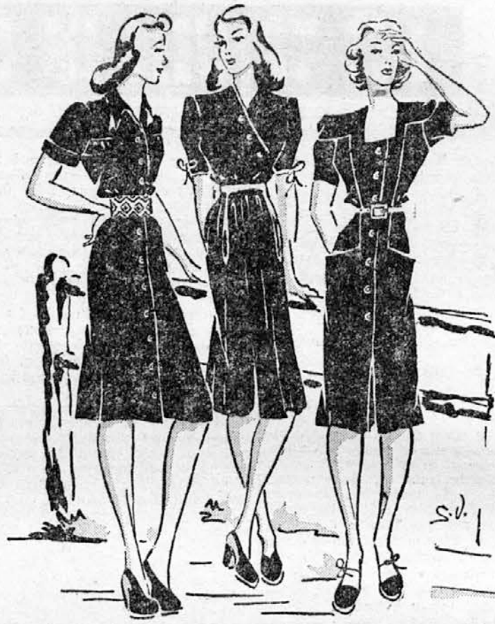
(Ti trije modeli so risani izrečno za »Družinski tednik« in niso bili še objavljeni) Iz temnomodrega platna ali iz kakšne stare enobarvne obleke naredimo enostavno sportno obleko. Poživi jo samo črko bel pas iz domačega platna, izvezen z narodnimi vzorci. — Temnoredča obleka z belim pasom. Zepi so beli, prav tako so beli pošivi tudi okrog vratu in rokavov. Krilo je zelo široko. — Sportna obleka iz šantunga kakavske barve. Zepi so globoko všiti, izrez je preprost in štiroglav.

Otroci staršev, ki se ne razumejo, so siromaki, vseeno, ali živita oče in mati drug ob drugem, ali če se ločita. Da, včasih je za otroka še hušje, če posluša vsak den kako se oče in mati prepirata, mučita, ponižujeta. Otroci ločene matere je pa že v nežnem detinstvu prikrajan, saj nobena skupnost otroku ne more dati toliko kakor urejen dom in harmonično družinsko življenje. Zato ljudje ne bi smeli sklepati zakonov brez ljubezni, roditi brez ljubezni otroke in jih nato brez ljubezni postavljati v življenje. In res je, kakor je napisal neki velik filozof: »Otroke bi smeli imeti samo srečni ljudje.« Srečni bomo pa le, če bomo premagali sami sebe v vsakdanjem življenjskem boju svojim najljubšim in najbližjim v srečo in korist. S. I.