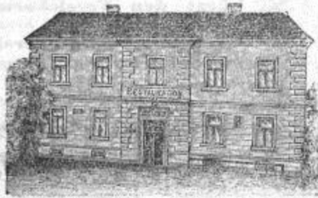
Um zahlreichen Zuspruch ersucht

mit Kenntnissen der französischen Sprache wird sofort aufgenommen. Offert mit Gehaltsanspruch und Photographie erwünscht unter „Stenograph“, postlagernd Heilenstein.