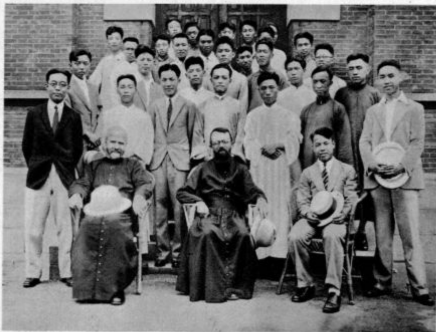
Visokošolci, člani Marijine družbe na univerzi v Sanghaju na Kitajskem, kamor so prodrli Japonci

V skupnem delu. Za srečno izvršitev mednarodnega Evharističnega kongresa v Budimpešti se vzajemno podpirata cerkvena in državna gosposka. Ta skupnost se ne kaže samo v tehničnem oziru, ampak tudi v duhovni in duševni pripravi na kongres. Prestolno mesto Budimpešta je ukrenilo vse potrebno za olepšavo ulic, za ojačevalce med kongresom, za točno poslovanje pošte, za rediteljstvo. Državnim in drugim nameščencem bo dana prilika, da se bodo mogli kongresnih slovesnosti osebno udeležiti. Tudi bodo zanje oskrbljeni evharistični večeri, ki se bodo pri njih pripravljali za prejem svetih zakramentov. Tako bo pravi verski in evharistični duh prežl