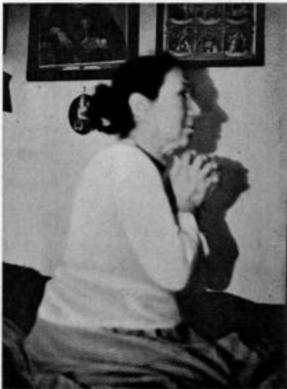
Slovenska mati pri jutrnji molitvi

»O, domov je prišel? Potem bo torej res, da misli njegova visokost prodati graščino?«