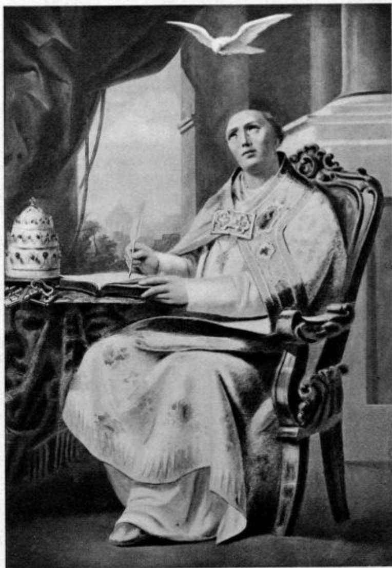
Cerkev: Šmartno pod Šmarno goro

Ta reč morda ne bo za vse in za vsakega. Tu velja beseda Jezusova: »Kdor more umeti, naj ume!« Gedeon v stari zavezi je s samo 300 najpogumnejših junakov premagal veliko številnejšega sovražnika. Tudi za ta sveti boj