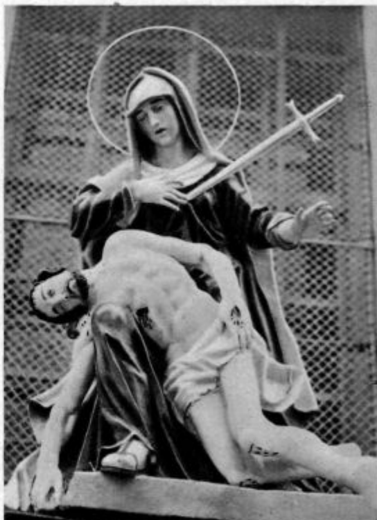
Zalostna Mati božja

Salvator je bil, kot rečeno, starček sedemdesetih let in zaradi kapi napol ohromljen, poleg tega pa slaboumen in bolehen. Preživljal je svoje stare dni v tej puščobi in edina družčina so mu bili njegov črni pes, kokoši ter nekaj kozâ, ki jim je puščal, da so se prosto pasle po nasadu, kjer si je uredil majhno zelenjadno gredico in jo oskrboval. Sicer pa je pobiral fige in mandlje, ki so padali z drevja.