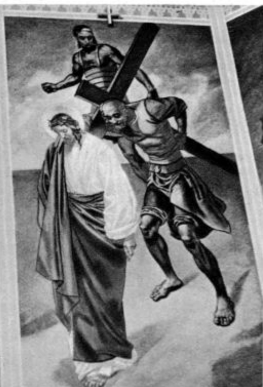
Župnijska cerkev na Bledu