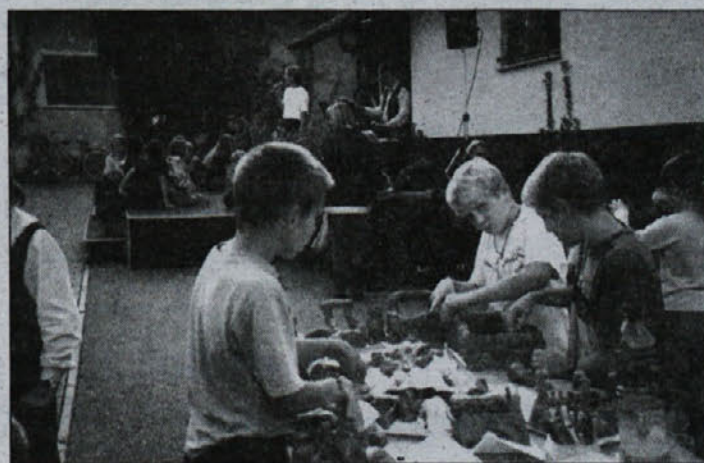
Ustvarjalne delavnice pod mentorstvom vzgojiteljic iz Podbočja so potekale pod naslovom "Hočem, torej zmorem".