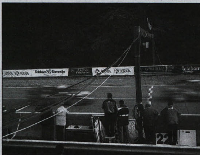
Številni obiskovalci so bili navdušeni nad atraktivnimi voznjaji.