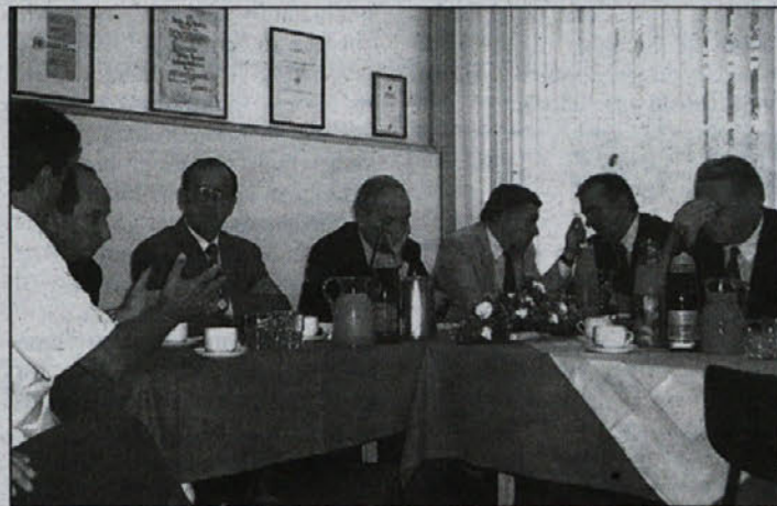
Minister na obisku v bolnišnici Brežice

Zaposleni, predvsem predstojniki oddelkov, so opozorili na kadrovske težave, saj potrebe po zdravstvenem kadru rešujejo s hrvaškimi kolegi. V srednjeročnem planu si je bolnišnica postavila za nalogo izboljšati kadrovske strukture in do leta 2005 pridobiti deset novih specialistov. Na ministru vprašanje so izpo-