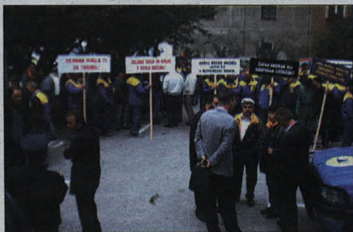
Protest delavcev Togrela