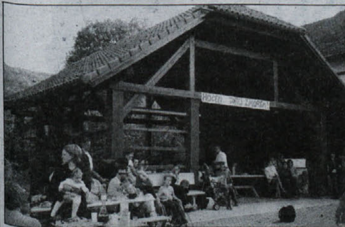
Pod Kerinovim kozolcem so se zbrali otroci in starši na prireditvi "Imamo se radi", ki jo je organiziralo DPM Podbočje.