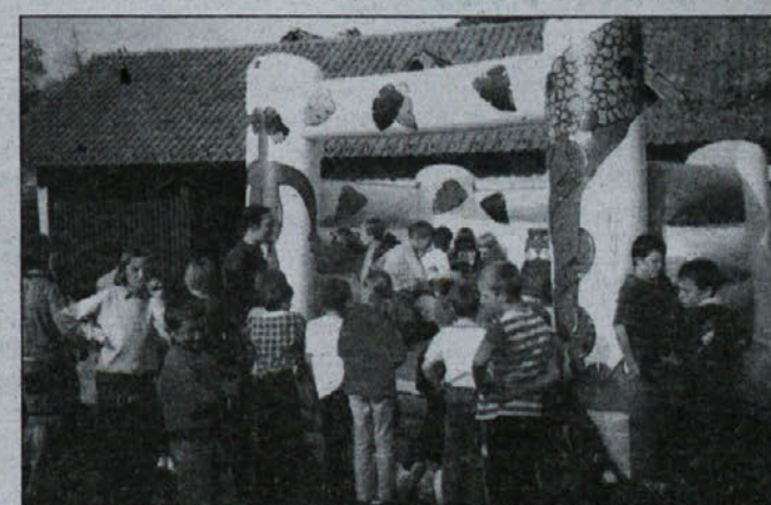
Seveda pa je zelo veliko veselja otrokom naredil potujoči grad, ki ga je Zveza prijateljev mladine Krško selila iz kraja v kraj.