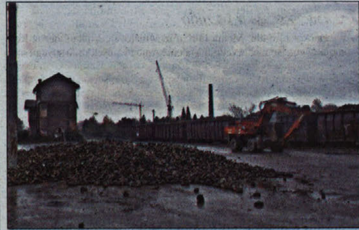
Sladkorna pesa na brežiški železniški postaji čaka na prevoz v Ormož.