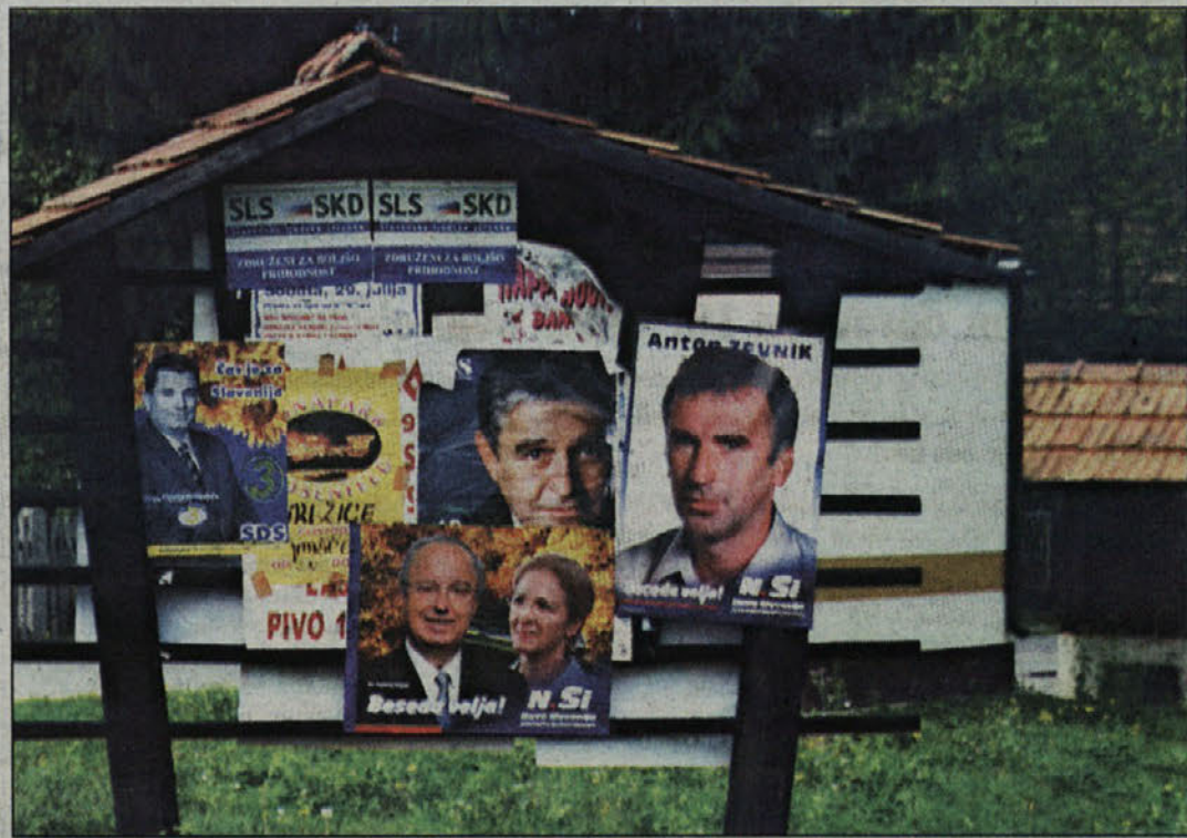
Volilna kampanja je letos umirjena, le LDS je zaenkrat podala ovadbo zaradi kršenja Zakona o volilni kampanji, vendar je kršitev tudi prekrivanje plakatov.