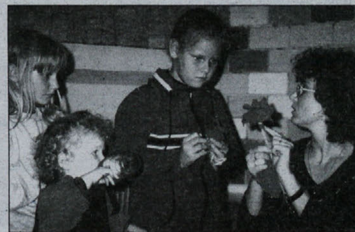
To pa je fotografija iz delavnice v Leskovcu pri Krškem, kjer so otroci izdelovali vetrnice in suho cvetje.