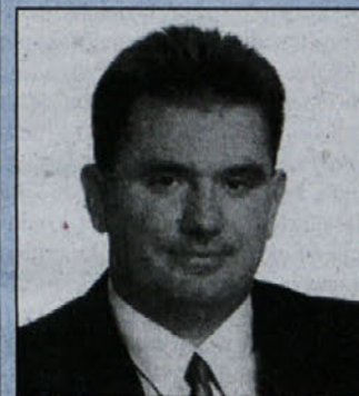
Državni sekretar mag. Andrej Vizjak

V II. steber Akcijskega programa zaposlovanja za leti 2000 in 2001, ki je namenjen pospeševanju podjetništva, so zajete ključne aktivnosti, namenjene povečevanju podjetniške naravnosti različnih ciljnih skupin prebivalstva, posebno pa mladih, žensk in ljudi na podeželju.