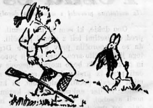
Zajec: »Oprostite, to je Vaš nos, kajne?«

S pozdravnim govorom angleškega kralja je bilo v sredo otvorjeno v Londonu takozvano »zborovanje pri okrogli mizi«. Na konferenci se posvetujejo o bodoči indijski ustavi. Zastopan pa ni na konferenci indijski narodni kongres, ki stoji pod vplivom Ghandija. Naša slika nam kaže nekaj odličnejših indijskih knezov (maharadž) v njihovih slikovitih nošah. Gornja slika: Nawab-a iz Bhopal-a, Gatiwar-ja iz Barode, na spodnji sliki maharadža iz Alwara, in maharadža iz Thalawara.